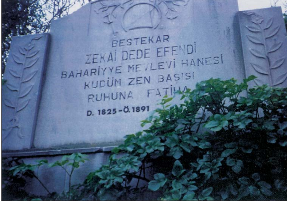
Zekâî Dede Mezar taşı, , Eyüpsultan Belediyesi Kültür ve Turizm Müdürlüğü Arşivinden

miz tesirleri maalesef gereği gibi söyleyememiştir.