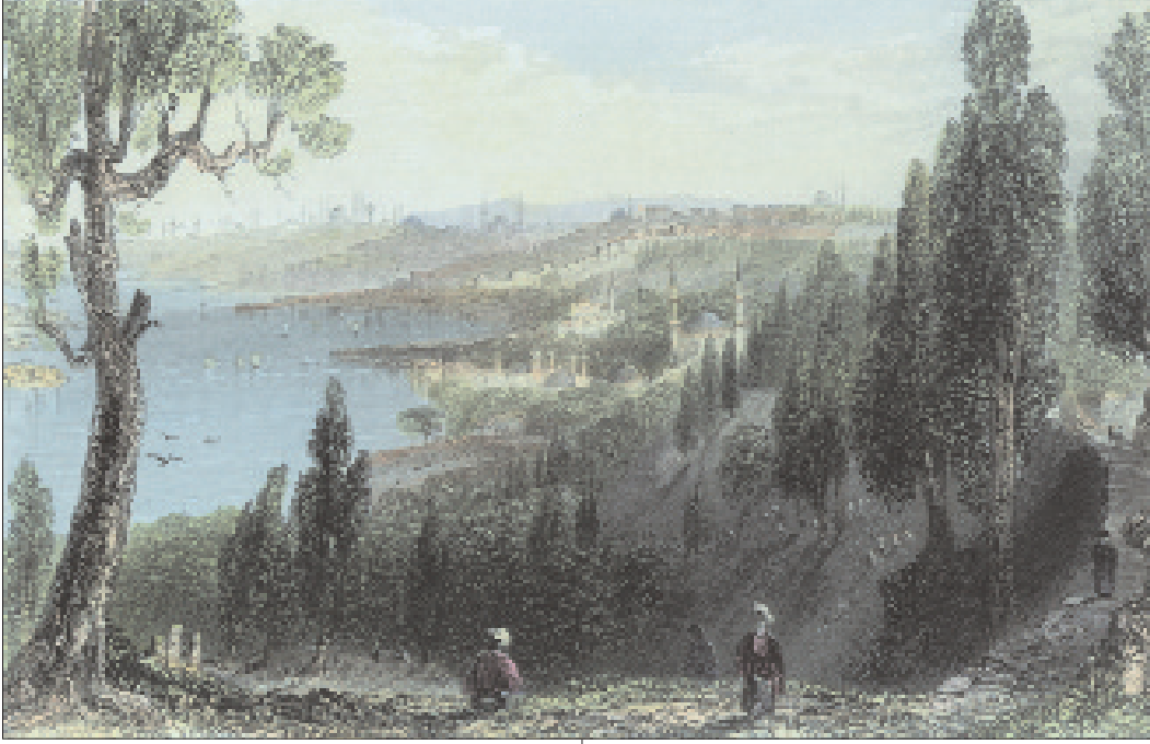
Piyerloti sırtlarından Eyüp, Gravür

menkıbe günümüze kadar ulaşmıştır. Aişe (r.a.) tarafından nakledilen bir hadis, buna bir örnek teşkil eder: