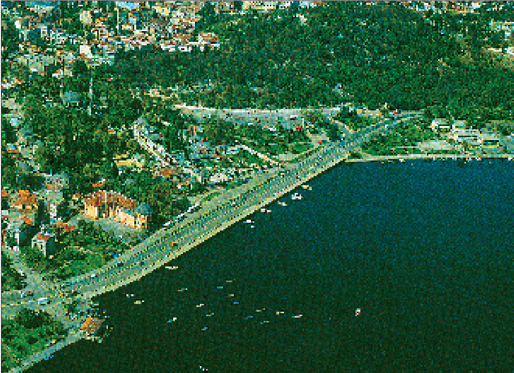
Resim 1. Hz Eyyüb El Ensari'ni adını verdiği semt Eyüp

2. Hz. Hatice; Hz. Muhammed'in ilk eşi, Müslüman olan ilk kadındır. Esed kabilesinden Hüveylid'in kızıdır. Hz. Muhammed ile evlenmeden önce Temim kabilesinden Ebu Hâlâ ile, onun ölümünden sonra Mahzum kabilesinden Atik bin Aiz ile evlenmişti. Bir süre sonra ikinci kocası da öldü. Hatice'nin bu evlilikten çocukları vardı. İkinci kocasının ölümünden sonra bir süre dul olarak hayatını sürdürdü. Mekkeli soylu kişilerin evlenme tekliflerini her defasında reddetti. Çok zengindi, ticaretle uğraşıyor, Arabistan'ın çeşitli bölgelerine kervanlarla mal gönderiyordu. Bu sırada kervanlarından birine başkanlık eden Hz. Muhammed ile tanıştı.