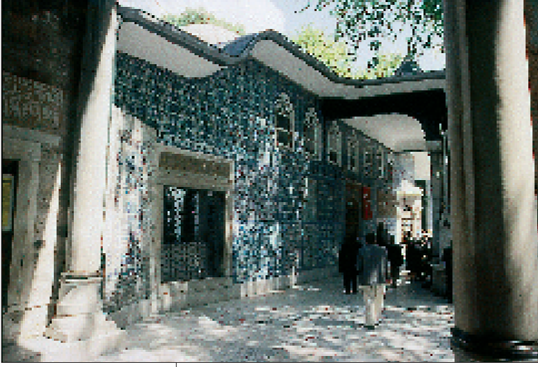
Resim 3. Hz Eyyüb El Ensari'nin türbesi (13)

ağacın yanında bulunan bir kuyudan almıştır ki, orada hala bir mescid bulunmaktadır. Hz. Muhammed'in Kureyşliler ile 628 yılında burada yaptığı ve "Hudeybiye antlaşması" olarak tarihe geçen antlaşma, Kureyşliler'in İslâmiyeti tanımalarına ilişkin ilk belge olması nedeniyle önemlidir (1,S.5410; 2,C.I., S.178).