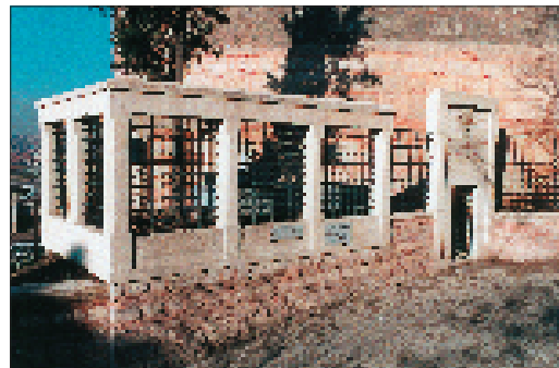
Resim 7. Ka'b (Hz. Ka'b) türbesi (13)

Türbenin iç avluya bakan çinili dış duvarının; avluyu çevreleyen ve onüç kubbesi olan revaklı diğer üç duvar ile birleştiği köşelerde, biri, mihrap aksının sol tarafında yer alan Bostan iskelesi Sokağı'nın devamına çıkılan, diğeri sağ