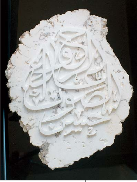
Eskişehir taşı üzerine yine Eskişehir taşı oyular yapılmıştır. "Hüsn-ü savt gıda errub" (Güzel name, rubun gıdasıdır) mealinde celi süslü istif. Zeki Kuşoğlu tarafından yapılmıştır.