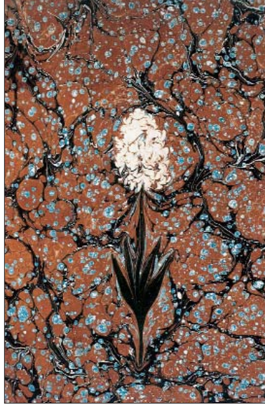
Susam çiçekli M. Düzgünman Ebrusu. M. Zeki Kuşoğlu arşivinden. Arşivde yüzün üzerinde çeşitli ebrular mevcuttur.