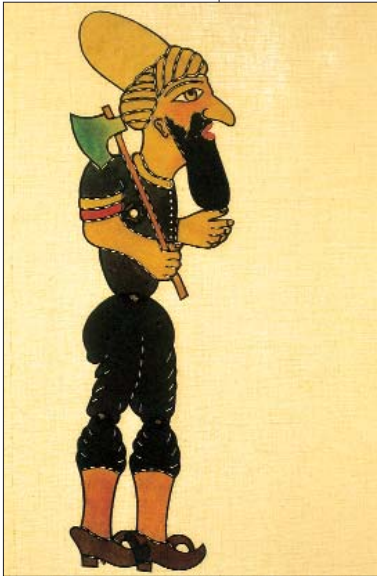
Deve derisinden oyulmuş Hacıvat Karagöz serisinden Himmet Ağa (Türk) tasviri. M. Zeki Kuşoğlu tarafından yapılmıştır.

Müzeler kurulurken ikinci önemli hu- sus ise dünü ve günü anlatan güzel bir kütüphanesi olmalıdır. Bu kütüphane günümüz anlayışına göre tanzim edil- meli milletler arası iletişime bağlı ve araştırmacılara açık olmalıdır. Yukarıda söylediğim hususlar ve daha söyleye- ceklerimle esas temas etmek istediğim nokta, tıpkı Osmanlı'daki külliyeler gibi içinde çeşitli etkinliklerin olabileceği insanı ma- nen doyuran bir müzeler olmasıdır. Dündeki