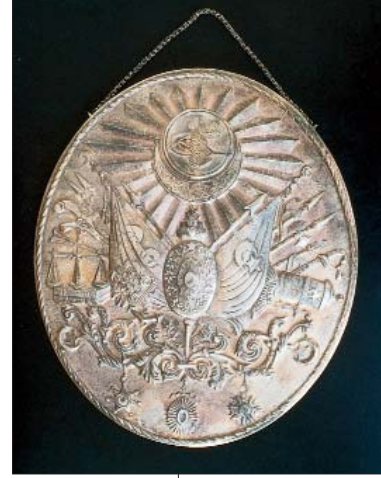
Gümüş kakma Osmanlı arması Ayna arkası olarak M. Zeki Kuşoğlu tarafından yapılmıştır.

güzellikleri görme yalnızca onlara hayran olmamızı gerektirmemeli, gerektirmemeli diyorum çünkü müzeler bugüne kadar sanki o işlevi yerine getiriyormuş gibi algılanmıştır. Halbuki müzelerin kişilerin öldükten sonra yaşaması, unutulmaması için hakiki kalıcı eserler ortaya koyması fikrini aşılması gerekir. Böylelikle insanlar kalıcı eserler yapmaya yönelirler.