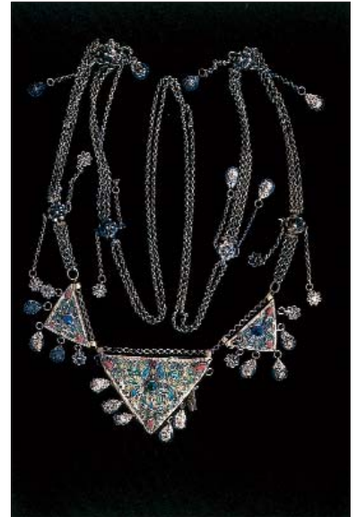
Analı kuzulu tabir edilen mineli muska gerdanlık