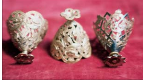
Gümüş Osmanlı fincan zarfı. M. Zeki Kuşoğlu arşivi.