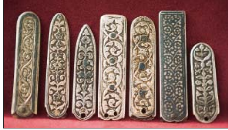
Kafkasya Dağistan yöresine ait kemer parçaları, derin kalem oygulu ve savatlı M. Zeki Kuşoğlu arşivinden.