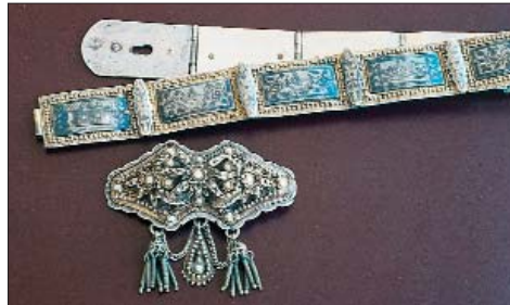
Savat işçilikli gümüş Van kemeri.

ni yapmalı. Peki nasıl bir müze kurmak bu işe yardımcı olur sorusunu bana sorarsanız: Bir müzede, eserlerin korunacağı birimleri yaparken çalışanların ve ziyaretçilerinin beraberinde getirdikleri çocukları için oynarken, dinlenirken, içinde dünü öğrenebilecekleri açık ve kapalı birimlerin olması gerekir. Buralarda sanat tarihi ve çocuk pedagojisini tahsil uzman hocalara gerek vardır. Buralarda geleceğimiz düşünülürken sarımsak sirke hesabı yapılmamalıdır. Okul öncesi eğitimsizliğimizin ve güzel sanatlara değer vermeyişimizin (güzel sanatlar eğitimi, bir eser ortaya koyup kopmamaktan ziyade, onu sever, anlar, korur, onunla dinlenir, zevklenir,