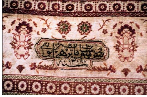
Resim 8: Dolmabahçe Sarayı halı detayı.

Feshane halıları konusunda vereceğim son örnek, Çanakkale Zaferi nede niyle, Mustafa Kemal Paşa için, Talat Paşa tarafından birbirinin eşi ve iki adet olarak sipariş edilmiş olan halılardır. 1918 yılında Atatürk'e armağan edilmiş olan bu halılar, manevi oğlu Sayın Abdürrahim Tunçak'ın koleksiyonunda bulunmaktadır. Halının üst bordür köşesinde Osmalica "Harb-i Umumiden 1334 (1918)", alt bordür köşesinde ise "Çanakkale Muzafferiyatı Hatırası 1331 (1915)" yazılıdır. Halı, Çanakkale