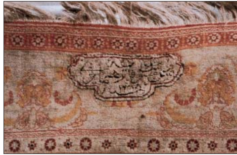
Resim 9: Dolmabahçe Sarayı halı detayı.