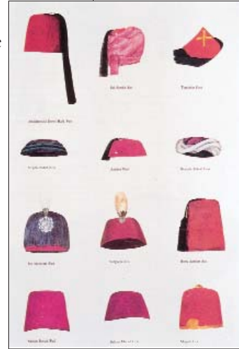
Resim 3: Osmanlı dönemi fes örnekleri.