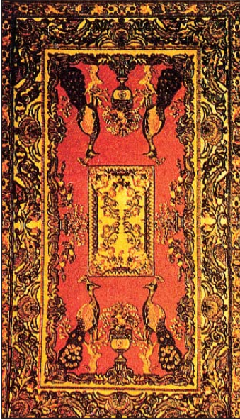
Resim 7: Feshane, kuşlu balı.

kaları Umum Müdürlüğü" emrinde çalıştırıldı, – 1925'te "Sanayi ve Maddin Bankası"na devredildi,