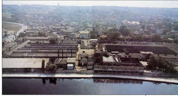
Resim 1: Feshane genel.

1838'de Eyüp'te Defterdar koyunda Himetullah Sultan Sarayı'nda (Sultan III. Selim'in kızkardeşi Hatice Sultan'ın sarayı), Feriye kısmına taşındı. Fes imalatı devam etti. Tunus'tan fes ustaları getirildi.