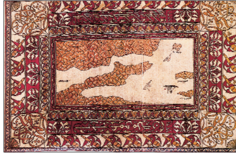
Resim 10: Çanakkale Boğazı panoramalı halı.

Boğazı panoramasını göstermektedir (res. 21).