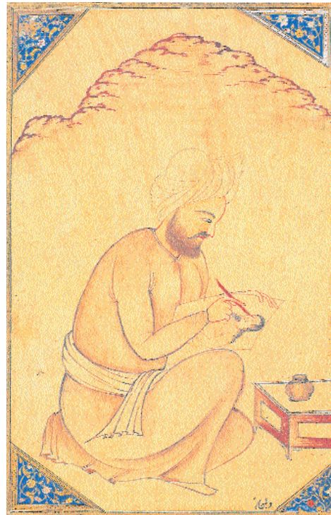
Alta: Nakkaş tasviri, albüm resmi