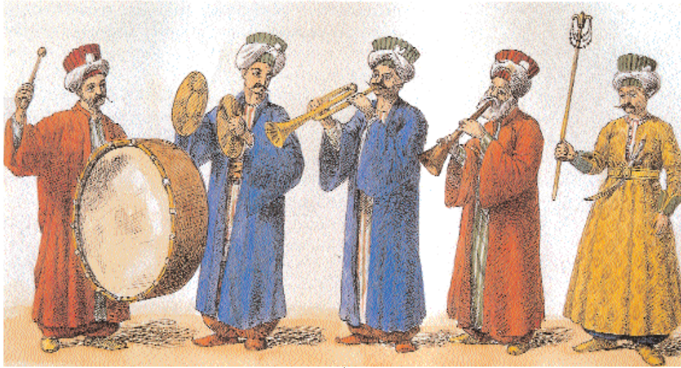
Osmanlı mehterinde sazandeler ve kullanılan enstrümanları gösteren minyatür.

Osmanlı Devleti ve Medeniyeti konulu Üçüncü Eyüpsultan Sempozyumu'nda konuyla ilgili olan "Yediyüzyıllık Medeniyetimizdeki Türk Musikisi" üzerinde durmak istiyorum.