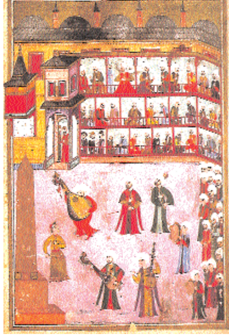
Osmanlı saray eğlencelerini saz ve sazandeleri gösteren minyatür.

Biraz önce de söylediğimiz gibi millet eskiden beri musikisine karşı taşıdığı sevgi ve bağlılık ile onun unutulmaması, yok olmaması için kendisine düşen oranda mahalli belediyeler ve derneklerde bu sanatı yaşatmaya çalışmıştır. Bu arada baskılar karşısında Devlet bazı şehirlerde "lütfen" Türk musikisi koroları kurmuştur. Televizyon kanallarında Türk Müziği korolarına imkân verilmiştir. Ancak bunlar sıradan programlar