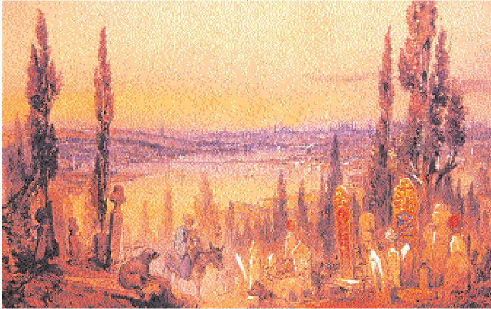
*4. Amedeo Preziosi, "Piyer Loti'den Haliç", 40x59 cm., kağıt üzerine suluboya, (İRHM koleksiyonu), (Hâlenur Kâtipoğlu (Yayına Hazırlayan), Mimar Sinan Üniversitesi İstanbul Resim ve Heykel Müzesi Koleksiyonu/The Collection of İstanbul Museum of Painting and Sculpture Mimar Sinan University, YKY, İstanbul 1996, s. 142)

rarası Sergi'de, 1880 ve 1881'de İstanbul'daki ABC Kulübü'nün sergilerinde sergilendi. 1860'lardan sonra İstanbul'un batılılar tarafından eski çekiciliğini yitirdiğini gören sanatçı, tema çeşitliliği sağlamak üzere 1862'de Mısır'a, 1868 ve 1869'da Romanya'ya gitti. Yaşamının son dönemlerine ilişkin çok az bilgi bulunan sanatçı, II. Abdülhamid'in saray ressamı olmuş, Yeşilköy'de yaşamış ve Beyoğlu'ndaki atölyesinde çalışmalarını sürdürmüştü ve 27 Eylül 1882'de Yeşilköy'de bir av kazasında yaralandıktan sonra ertesi gün yaşama veda etmiş ve Yeşilköy'deki San Stefano Katolik Mezarlığı'na gömülmüştür.(19)