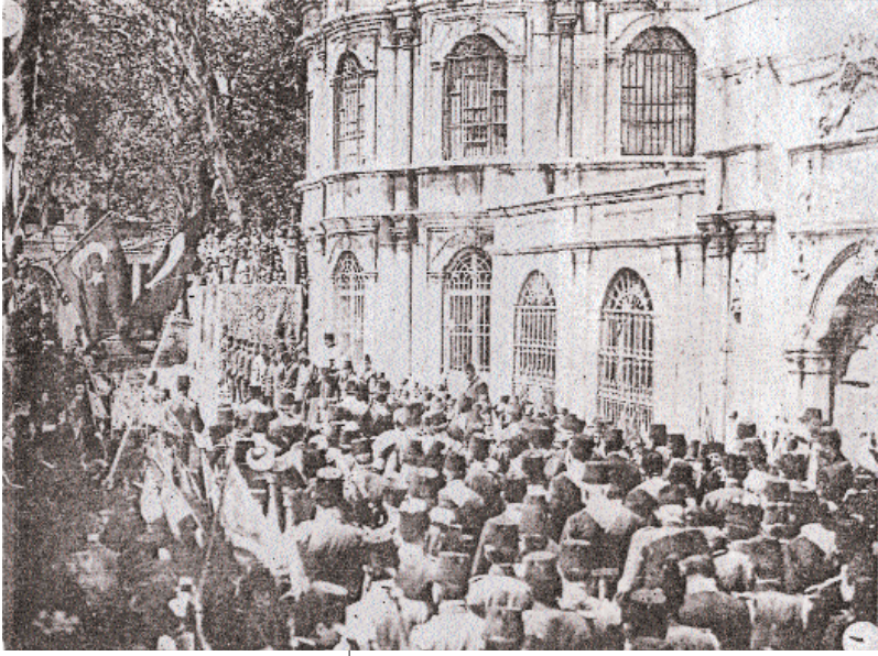
Sultan Reşat dönemi bir merasimden görünüşü.

yeri belli olan Kabr-i Şerîf sonradan kayb olmuş ve Fâtih, şeyhi Akşemseddîn'in istihâresi ile ortaya çıkarılıp(9) bugünkü yerine Câmî'i ve Türbesi'ni yaptırmıştır.(10)