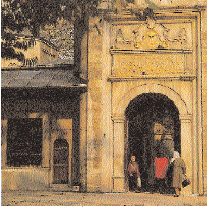
Eyüpsultan Câmî'i şadırvanından iç avluya açılan kapı ve solunda Türbe'nin çıkış kapısı.

kılan da burada yatan ve buraya adını vermiş olan, Mihmandâr-ı Rasûl Ebû Eyyûbel-Ensârî Hazretleri'dir. O olmasaydı, ne burası her gün bayram yeri gibi bir ziyâret merkezi olur ve ne de burada İslâm mi'mârîsi ve güzel san'atlarının açık hava müzesi hâlindeki böyle bir Eyüb semti kurulurdu.