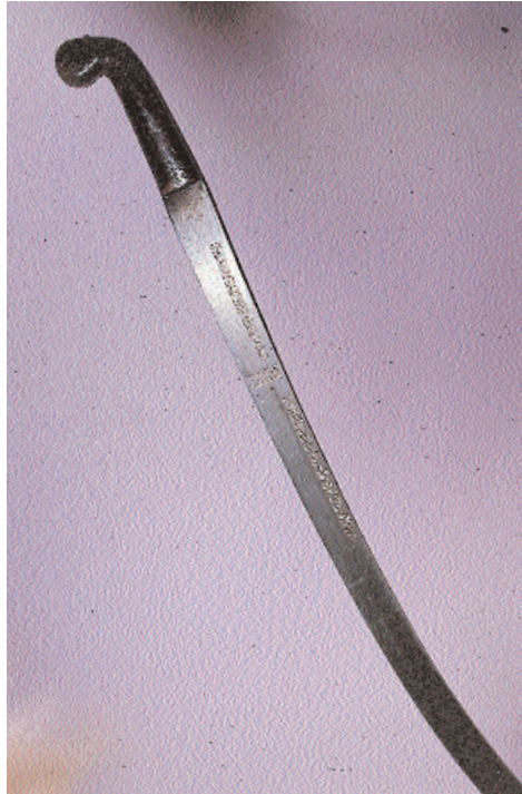
Fotoğraf 9: Memluk Sultanı Kansu el-Gavri'ye (1501-1516) ait kılıç. Boy:97 cm., Askeri Müze, Env.237

Sözünü ettiğimiz bütün bu silahlar ve ait olduğu kişiler Osmanlı Cebehanesinden Askeri Müze'ye intikal etmiş binlerce silah üzerinde yapılan yoğun araştırmalarla tesbit edilmiş olup, her eser üzerinde sahibinin adı