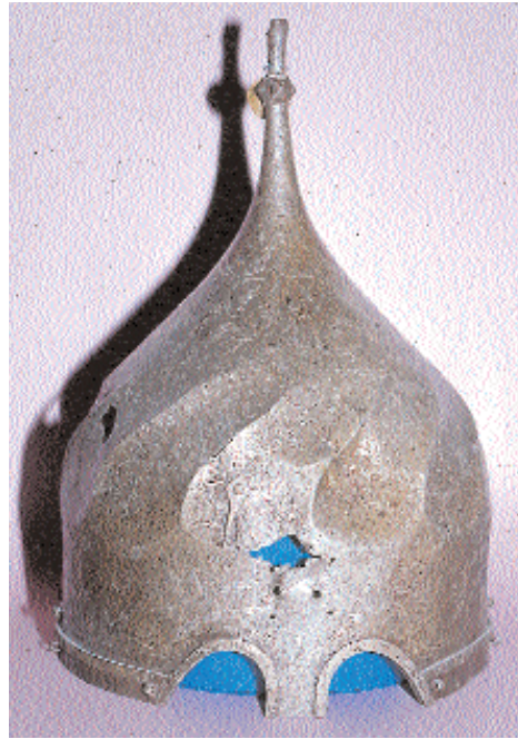
Fotoğraf 6: Memluk Sultanı Şeyh el-Müeyyad'a (1412-1421) ait miğfer, Yükseklik 35 cm., Çap:24,5 cm., Askeri Müze, Env. 14628