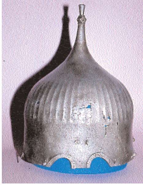
Fotoğraf 5: Timurlu Sultanı Mehmed Babadır Han (1442-1451)'a ait miğfer, Yükseklik: 30 cm, çap: 23 cm., Askeri Müze, Env.9484 Kitabe: (Türkçesi) Mükemmellik timsali, gücü, Allah onu koruyacaktır. Sultan Mehmed Babadır, bütün Sultanların, Şahların, bütün dünyanın merkezi. Vücudunun üzerindeki baş gökyüzüne doğru uzayacaktır.(3)