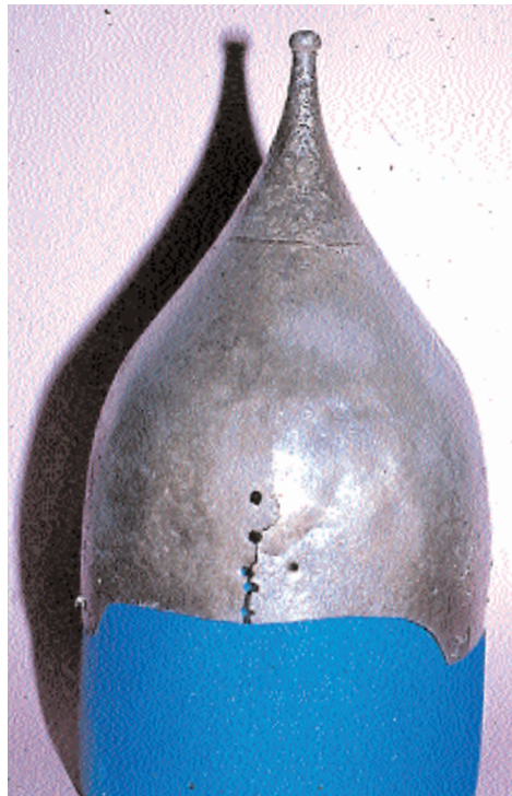
Fotoğraf 10: Kırım Hanı Bilalzade'ye ait miğfer, 18. yüzyıl, Askeri Müze, Env. 9482

yada mührü bulunduktan sonra bu listelere dahil edilmiştir. Toplu olarak ilk defa literatüre geçecek olan bu tesbitlerin bizden sonraki Tarih ve Sanat Tarihi araştırmacılarına 'Osmanlı İmparatorluğunun 700.Yılı'nda bir armağan olarak sunuyoruz.