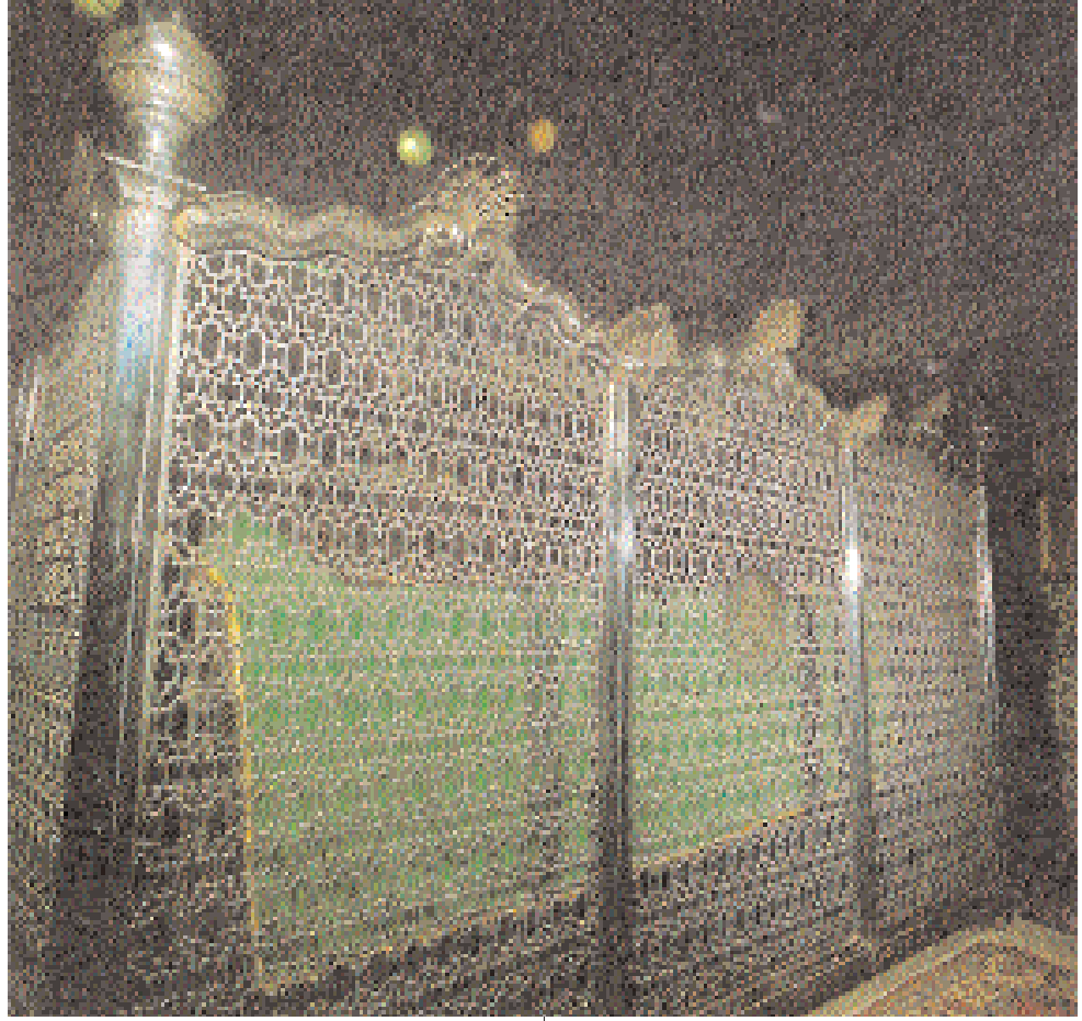
Eyüp, Eyüpsultan Türbesi içinden bir görünüş.

Onu fetheden komutan ne güzel komutan; o asker ne güzel askerdir "(2) Hadis-i Şerifi söylendiği günden itibaren müslümanlarda güçlü bir seveda oluşturmuştur. İstanbul'un fethinin müslümanlara takdir edildiği inancı, daima mevcuttu ve Osmanlılar'da bu inancı kuvvetle benimsediler. Müslümanlar Bizans'ın başkentine, 1453'teki fethinden evvel toplam on iki sefer düzenlediler (3). Müslümanların 624'te Filistin'de Bizans'a karşı gerçekleştirdikleri ilk askeri eylemin bizzat Hz. Peygamber tarafından düzenlendiği belirtilmektedir (4). Hz. Osman zamanında, Suriye sahillerinde kurulan İslam donanması, 655 yılında İstanbul'a karşı harekete geçmiş, Finike açıklarında İmparator Konstantin'in kumanda ettiği Bizans donanmasına karşı büyük bir zafer elde etmiş, fakat seferden vazgeçilmiştir.