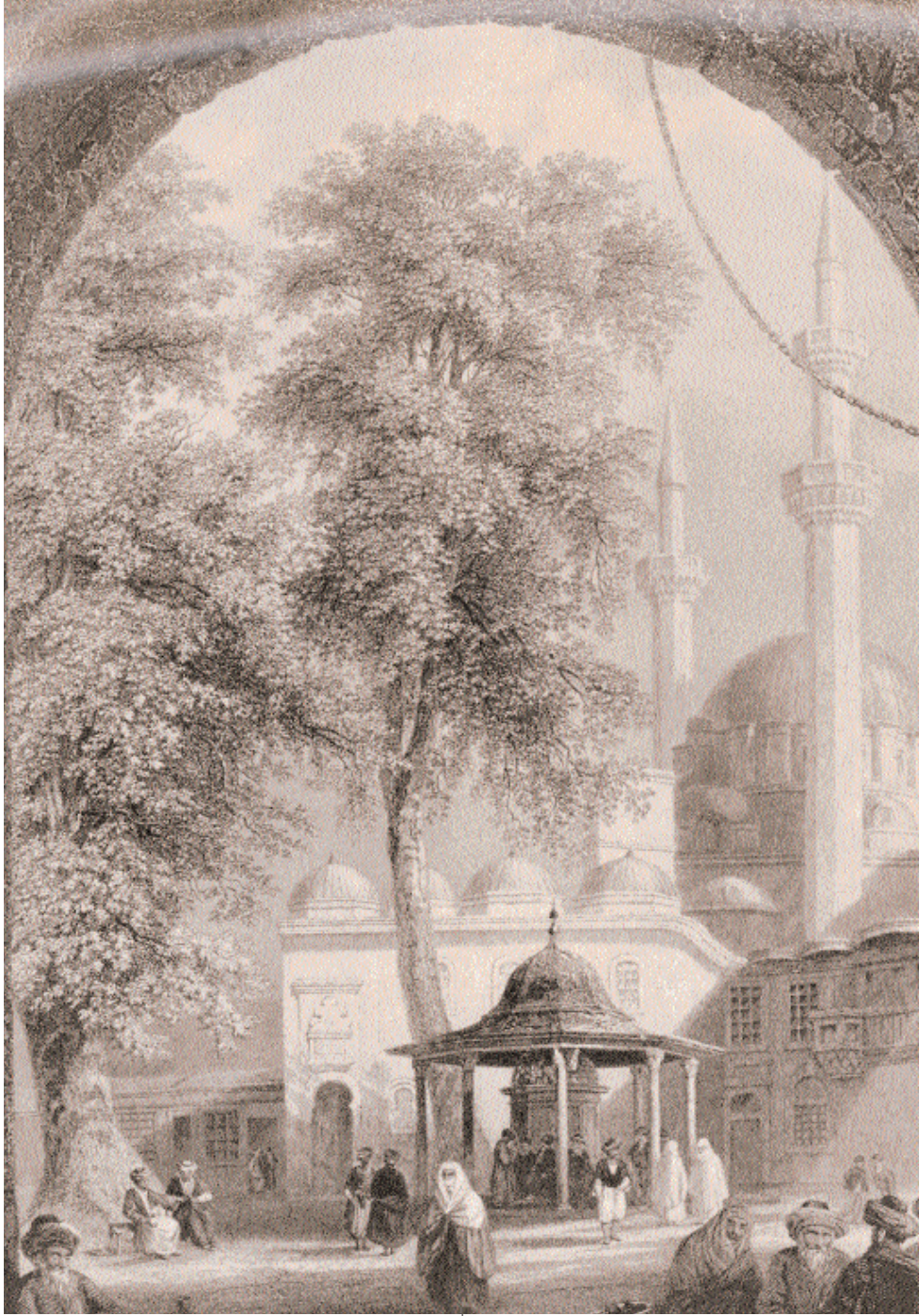
Eyüp, Eyüpsultan Camii ve Şadırvanı, Gravür.

İstanbul, M.Ö.VII. yüzyılda Megaralılar tarafından kurulmuş bir kenttir. Sahip olduğu coğrafi, iktisadi ve stratejik konumu sebebiyle kurulduğu tarihten itibaren Anadolu ve Balkanlarda kurulan devletlerin hedefi haline gelmiştir. Roma İmparatoru Konstantinus, rakibi Licinius'u Üsküdar yakınlarında yendikten sonra aynı yıl (324) imparatorluğunun başkentini İstanbul'a nakletmeyi karar-