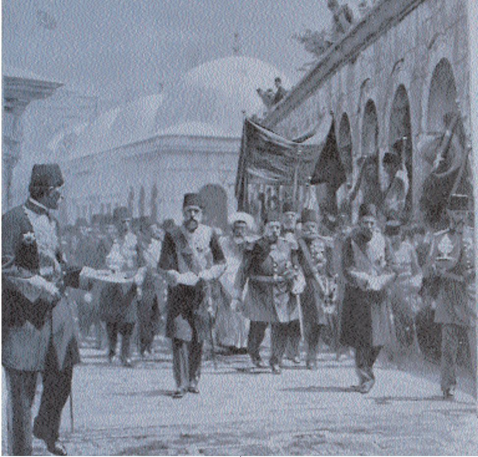
Eyyüp, Sultan Reşat'ın Kılıç Kuşanma Merasimi.

duğunu ve muhasaranın altı ay sürdüğünü söylemektedir. Bu muhasaraya İbn-abbas, Amr ibn-i Zübeyr gibi ashabın da iştirak ettiğini ve Ebu Eyyüb'un bu seferde şehit olduğunu yazmaktadır (7). Kendisinin, "İstanbul surlarının önüne mübarek bir adamın defnedileceğini" Rasulullah'tan duyduğu, o kişi olmayı arzu ettiğini söylediği İslam kaynakları belirtmektedir (5).