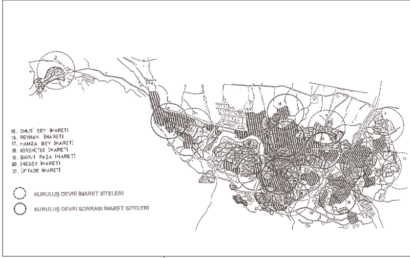
Şekil 2C: 16. yüzyıl sonunda Bursa kentinin yayılma alanı

laşık bir kilometre kadar uzaklıkta Yıldırım Külliyesi yapılmış,