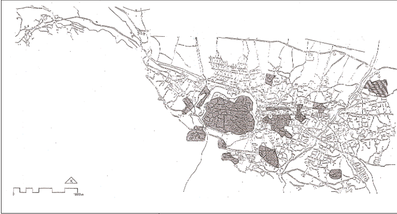
Şekil 2A: 14. yüzyılda Bursa Kentinin Yayılma Alanı

Türk egemenliğine geçtikten (1326) ve devletin yönetim merkezi olduktan kısa bir zaman sonra Hisar dışında birkaç kat büyümesi sonucunu getirmiştir.