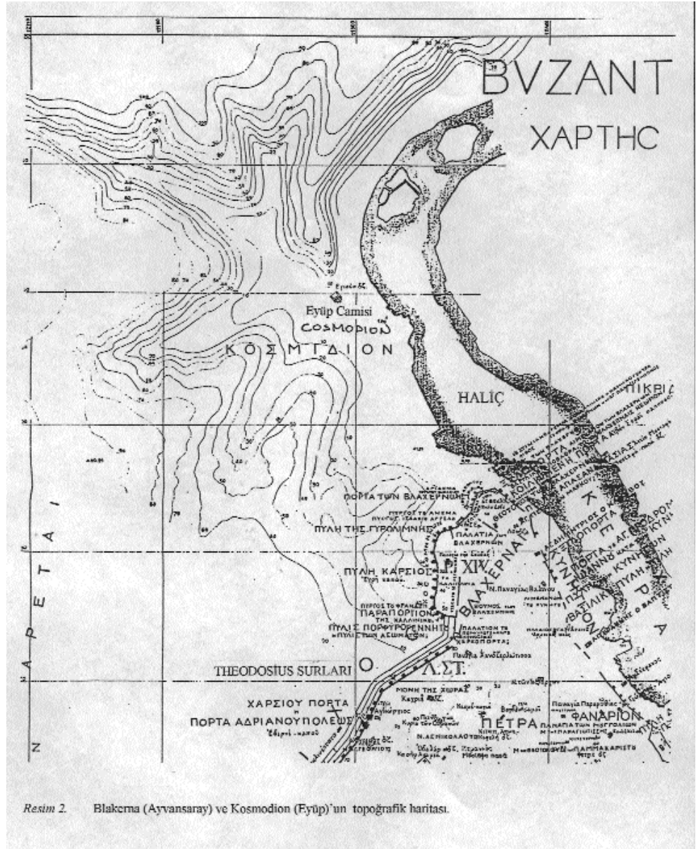
Resim 2. Blakerna (Ayvansaray) ve Kosmodion (Eyüp) 'un topoğrafik haritası.

yardımcıları tarafından yönetilir. İyileştirme umudu vadeden bu kutsal yer çok uzaklardan ziyaretçileri ve hacıları çekecek kadar ünlü ve önemlidir (Seiber 1977: 5). Bizans'a özgü olan kent azizlerinin buldukları kenti koruyan ve gözetken bir işlevleri olup kentsel yaşamın sürekliliği için varlıkları gerekli birer odak noktasıdır. Bu nedenle de kaderleri buldukları kent ile iç içedir. 626'daki Avar kuşatması sırasında yıkılan manastır 10. Yüzyılda Michael IV (1034-41) tarafından çeşitli eklemelerle daha geniş bir biçimde ve binayı bir duvarla çevreyerek yeniden inşa edil-