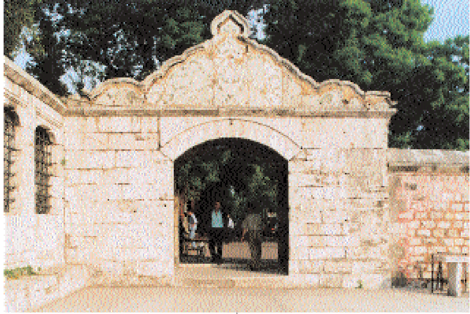
Resim 4. Nakşidil türbesi yönünden cephe fotoğrafı (1999).