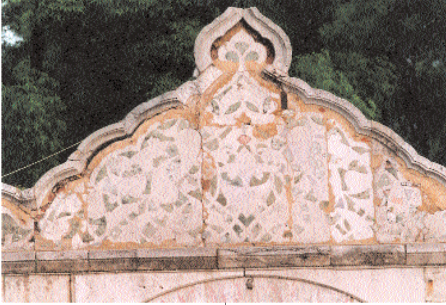
Resim 5. Cami yönünden alınmış tezyinatı (1999).