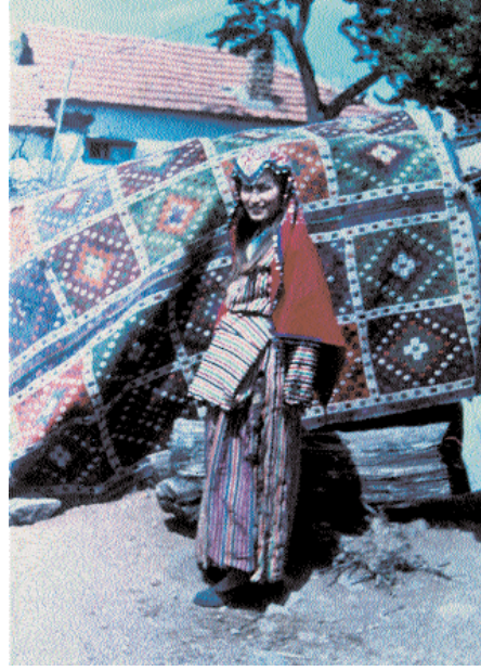
Res.11- Tabakalı zili (20 tabakalı), zili teknikli, yün, çeyiz eşyası, yaklaşık 50 yıllık, Tavukçukuru Köyü (Yunddağ-Bergama), 1986.

dokunduğunu düşünüyoruz. Geometrik desenli halı ve düz dokuma yaygıların, anılan yüzyıldan itibaren, Batı Anadolu, İç Anadolu, Doğu Anadolu ve Akdeniz Bölgesi'nde dokunduklarını, günümüzde de dokunmaya devam ettiklerini bugünkü örneklerinden anlıyoruz (Res.16).