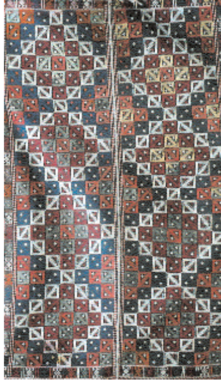
Res.13- Darak (Tarak) zili, yün, zili teknikli, XIX. yy. 256 x 152 cm. Şatırlar Köyü (Yuntdağ-Manisa) Cami, 1984.

minde görülen halılardaki hayvan figürlerinin benzeri örnekleri daha sonraki yıllarda da, az da olsa, değişik bölgelerde, değişik şekillerde günümüze kadar devam etmiştir: Günümüzde Konya ve Aksaray civarında enikli kilim , Batı Anadolu Bölgesi'nde Manisa ve Aydın çevresinde inekli kilim diye anılan kilimlerdeki motifler Beylikler dönemi halılarındaki hayvan figürü süsleme geleneğinin kilim üzerinde bugüne gelebilmiş örnekleridir. Bu da, aynı çağda, kilimlerin de halılara benzer şekilde motiflerle bezendiğini göstermektedir (Res.3-5).