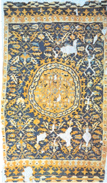
Res. 17- Saray kilimi, Divriği (Sivas), yün, 235 x 316 cm. XVI-XVII. yy. İstanbul Vakıflar Kilim Müzesi, En. No:A.316 (B. Acar, Kilim, Cicim, Zili, Sumak, s. 11'den).

Anadolu'da halkın dokuduğu kilimlerin pek çoğunda göbek vardır. Ancak, göbek şekli Göbekli Uşak halıları 'nda ve bundan gelişen saray kilimlerinde görülen göbekten çok farklıdır (Res.17). Halkın kullandığı göbek şekli genellikle kare, dikdörtgen, altıgen, sekizgen ve eşkenardörtgen şeklindedir (Res.16,18). Tüm Anadolu'da, genellikle aynı isimle bilinir. Sözelimi Batı Anadolu Bölgesi'nde Manisa, İzmir, Aydın, Uşak civarında göl ve sofra , Orta Anadolu'da Aksaray, Niğde, Kırşehir, Konya, Kayseri, Yozgat, Sivas yöresinde göbek , kafa , farda , bayrak , Doğu Anadolu'da Diyarbakır, Siirt, Bitlis çevresinde göbek , göl gibi isimlerle tanınır. Her birinin şekli birbirinden farklıdır. Mesela, Batı Anadolu