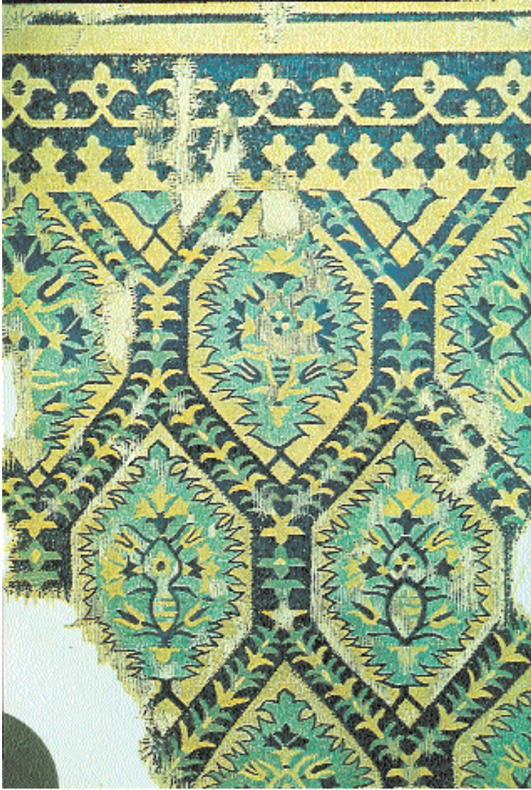
Res. 19- Saray kilimi, ayrıntı, XVI-XVII. yy. Konya Mevlâna Müzesi.

(Res.18). Son yıllarda Eşme (Uşak), Kütahya civarında tüccar tarafından dokutturulan, saray kilimlerine benzer, taklit örnekler mevcutsa da bunların gelenekli kilimlerle hiç bir ilgisi yoktur.