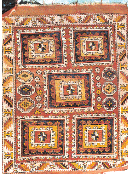
Res. 9- Altın tabak halı, yün, 136 x 186 cm. XVIII. yy. Korubaşı- Burgaz Köyü (Ayvacık-Çanakkale) Cami, 1990.

Erken Osmanlı Dönemi halılarında geometrik desenlerle süslü halıların bir bölümü, ilk kez Hans Memling 'in tablolarında görüldüğü için, kaynaklarda Memling halıları diye bilinir. Bu örneklerde zemin kare veya eşkenardörtgenlere bölünür. Bunların da içi çengel şekilli geometrik motiflerle doldurulur. Bu nedenle bu halılara çengelli halılar veya geometrik desenli halılar da denir (Res.15): İlk örnekleri XVI. yy. 'da görülen bu halıların benzerlerine daha sonra XVII-XVIII. yy. 'larda da rastlanır. Özellikle yabancı sanat tarihçiler arasında XVI. yy. örnekleri Memling halısı , XVII. yy. örnekleri ise çengelli halı diye anılan bu halıların Batı ve İç Ana-