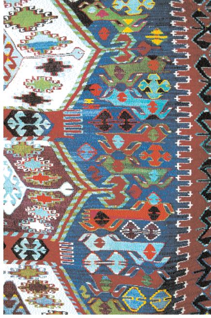
Res. 5- Farda kilim (inekli kilim), detay (inek motifi), 300 x 150 cm. yün, Selendi-Kürkçü Köyü (Manisa) Cami, Mart 1986.

Bugün Batı Anadolu Bölgesi'nde, özellikle, bir kısmı Manisa sınırlarında, bir bölümü de Bergama (İzmir) arasında kalan Yunddağ Bölgesi 'ndeki köylerle, yine Kaz Dağları ile Bergama ara-