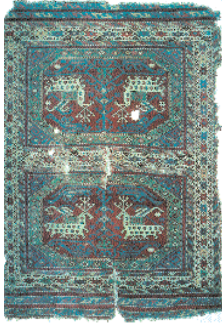
Res.1- Seccâde halısı (ejderli halı), XV. yy. sonu, İstanbul, Vakıflar Halı Müzesi.

Osmanlıların henüz imparatorluk hâline gelmediği dönemlerde halılarda görülen bu gelişmeler, muhtemelen, o dönemlerde düz dokuma yaygılar (kilim, cicim, zili, sumak) üzerinde de vardı. Henüz o dönemden günümüze gelebilen hiç bir örneğini bilmediğimiz hayvan figürlü düz dokuma yaygılarının,