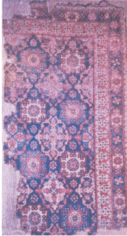
Res. 6- Erken Osmanlı Dönemi balısı, 1.tip., XV-XVI. yy. İstanbul T.İ.E.M.(G. Öney arşivi'nden).

sında kalan ve Bergama'ya bağlı bulunan Kozak köylerinde , Bergama ile İvrindi (Balıkesir) arasındaki Madra Yaylası köylerinde, Ayvacık (Çanakkale) çevresinde, XV-XVI. yy. Erken Os-