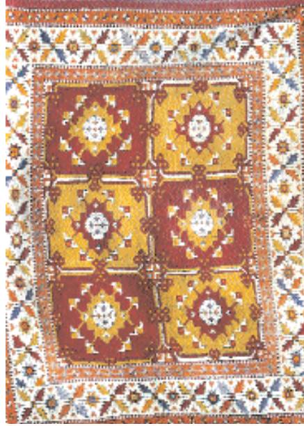
Res.10- Tabakalı halı, yün, XVIII-XIX. yy. Bayramcılar Köyü (Yunddağ-Bergama) Cami, 1987.

dolu Bölgesi'nde dokundukları kabul edilmektedir 10 . Doğu Anadolu Bölgesi'nde de örnekleri mevcuttur. Bu halıların XVIII-XIX. yy. da Doğu Anadolu Bölgesi üzerinden Kafkasya'ya, Karadeniz üzerinden de Avrupa'ya ihraç edildiği kaynaklarda belirtilmektedir 11 .