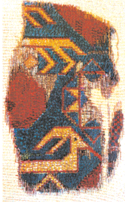
Res.2- Hayvanlı halı, detay, Fustat'da bulunmuş, XV.yy. başı, Göteborg Röhska Konstlöjdmuseum'da, evvelce Lamm koleksiyonu (En. Nm. 226/1939), (O.As-lanapa, Türk Halı Sanatı'nın Bin Yılı, s. 54).

Osmanlılar döneminde de dokunmaya devam ettiği anlaşılmaktadır. Ancak, bildiğimiz örnekler, genellikle, XVIII-XIX. yy. 'dan kalmadır. Öncesine ait örneklerini henüz tanımıyoruz. Günümüzde, özellikle İç Anadolu Bölgesi'nde Konya ve Aksaray, Batı Anadolu Bölgesi'nde Manisa ve Aydın civarında örnekleri hâlen dokunmaktadır (Res.3-5).