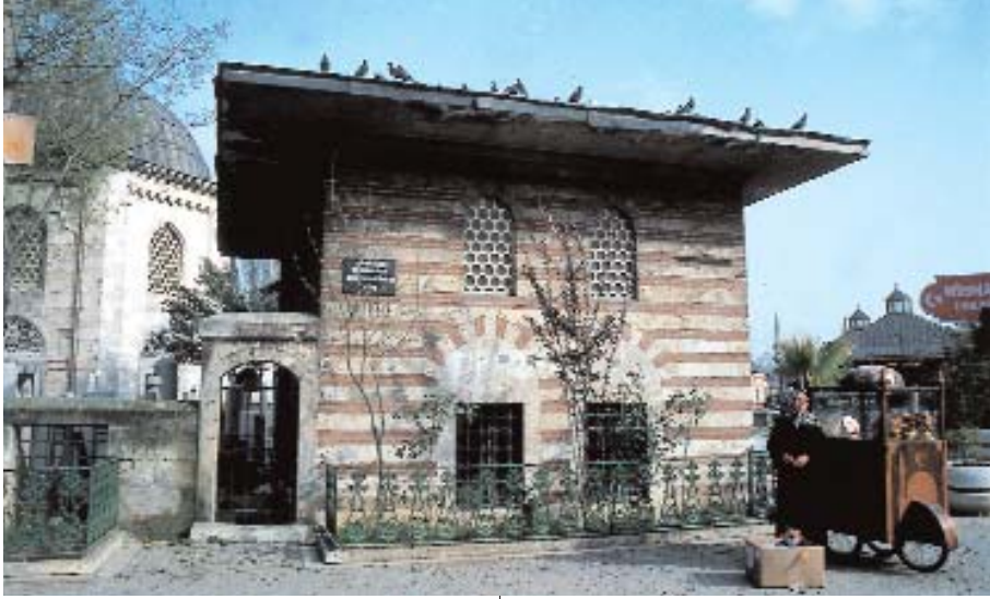
Üstte: Ebus-Suud Efendi Sıbyan Mektebi