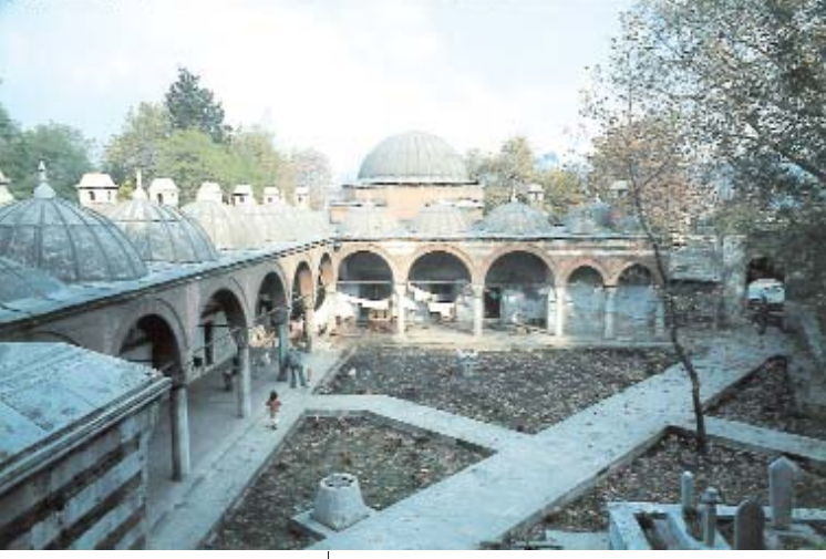
Üstte: Zal Mahmut Paşa Külliyesi Tabtani Medresesi