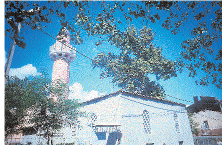
Resim 7. Düğmeciler Camii

1780'de geçirdiği yangından sonra yenilenen cami, bu yüzden eski planı ve mimarî özellikleri ile ilgisi kalmadığı ve geçirdiği onarımlarla özgün kimliğini yitirdiği anlaşıyor.