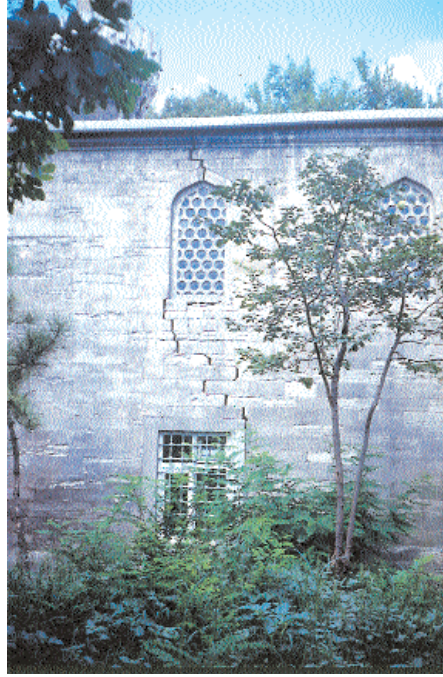
Resim 6. DeFTERdar Camii. Kible duvarındaki çatlak