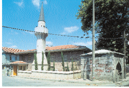
Resim 10. Şah Sultan Camii