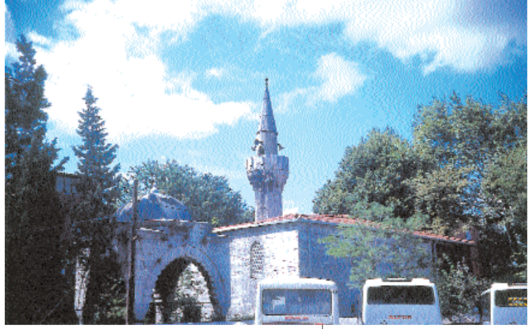
Resim 5. DeFTERdar (Nazlı Mahmud Efendi) Camii

Yapılış tarihi bilinmeyen cami, Tosyalı Celaddin'in oğlu Mustafa Paşa (öl.1567-8) tarafından inşa edilmiştir. Kareye yakın planı, dört yüzeyli çatısı ile birlikte sakıflı ve tek minarelidir.