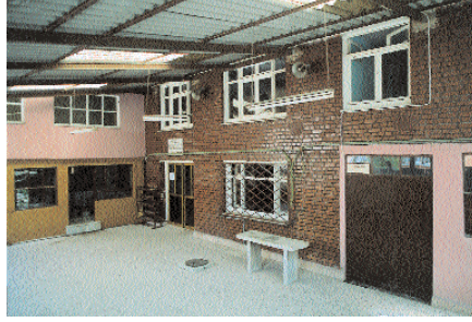
Resim 9. Süleyman subaşı Mescidi.