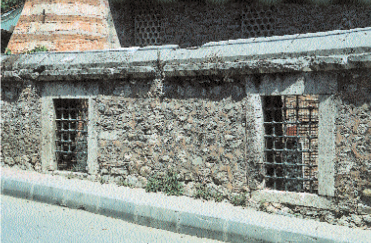
Resim 3. Davut Ağa Mescidi. İhata duvarında görülen tabrihatlar.