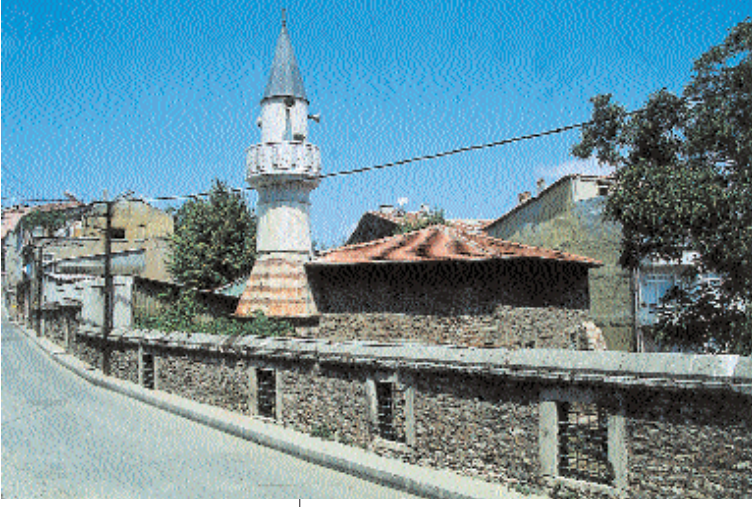
Resim 2. Davut Ağa Mescidi