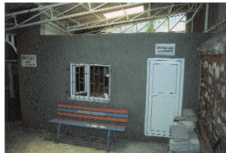
Resim 4. Davut Ağa Mescidi. İçeriye eklenen oda.