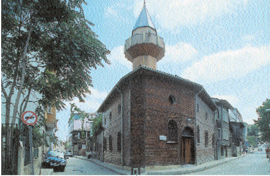
Resim 1. Arpacıbaşı Mescidi

Onaltıncı yüzyılın ünlü yapı ustası Sinan'ı genelde bir İstanbul mimarı olarak kabul etmek yanlış sayılmaz. Sinan'ın yaptığı dörtyüzün üzerindeki eserlerden en büyük payı İstanbul almıştır. Onaltıncı yüzyılda dünyanın en önemli kültür, sanat ve ticaret merkezi hâline gelen İstanbul, Osmanlı-Türk egemenliğinin, dünya üzerindeki simgesi olmuştur. Bu bakımdan İstanbul, Osmanlı Devleti'nin politik, ticarî, kültürel ve sanatsal gücünü sergileyen konumu ile, mimarî açıdan da önemli bir statü kazanmıştı. İstanbul'un bir dünya başkenti olarak önem kazanmasında, devletin politik gücüne ve anlayışına göre Sinan'ın, mimari çabalarını bu kent üzerine yoğunlaştırmasının büyük rolü olduğu unutulmamalıdır.