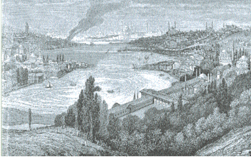
Eyüp, gravür S. Zeki Bağcı'nın arşivinden