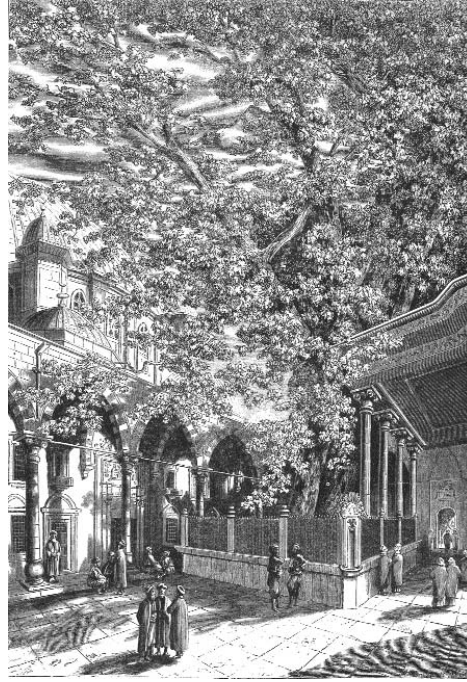
Eyüpsultan Türbesi ve Camii Avlusu, gravür

Nesneler dünyasına form veren, ideadır. "... renk karanlığa hakim olmanın ifadesidir. İdea, yani form, duyulur dünyaya, ateş ve renk aracılığıyla giriyor, karanlığa (maddeye) hakim oluyor ve duyulur dünyanın, cisimler dünyası-