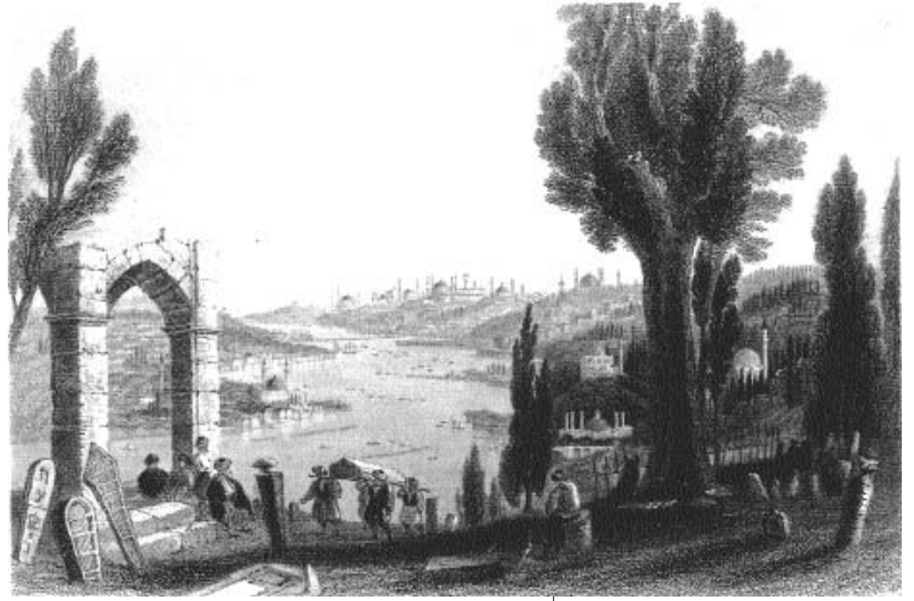
Piyerloti Tepe'sinden Halic, gravür. V. Bartlett, 1839

Ebu Eyyub, bu görüşmeden sonra vefat eder. Vasiyetine uyularak cenaze namazından sonra tabutu eller üzerinde hücumla kalkılır. Ceset, surlara yakın bir yere gömülür. Bizans devlet erkânı, surların gerisinden bu garip manzarayı hayretle seyrederek. Bizans tarafı ile Müslüman kuvvetleri arasında haberler