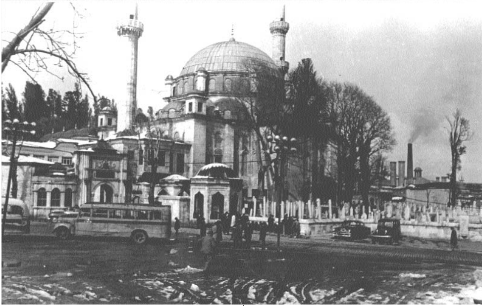
1950'li yıllarda Eyüpsultan'da bir kış günü İstanbul Bülteni, yıl 3 sayı 54.

lahüteala hazretleri Rum vilayetini bana ve benim ümmetime bağışladı, dedi.