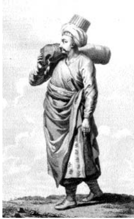
EYÜPSULTAN'A DEFNEDİLEN BİR İRAN ŞEHZADESİ