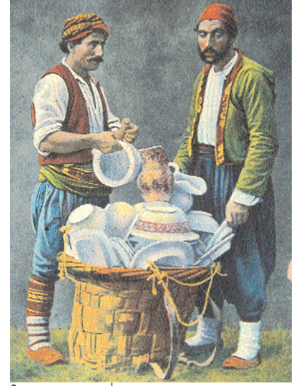
Resim 1-2; Çömlekçiler

İstanbul’un değişik semtlerinde bulunmaktaydı. Çömlekçiler ise Evliya Çelebi ve P.G. İnciciyana göre Eyüp çömlekçiler mahallesinde ve Boğazda Göksu’da bulunmaktaydı. (3)