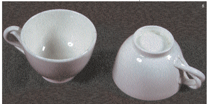
Resim 8; Fincan