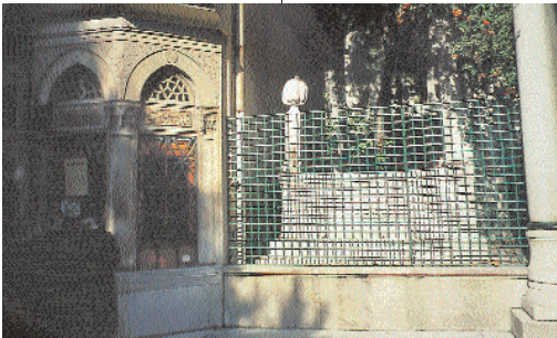
Resim 6; Semiz Ali Paşa'ya ait olduğu iddia edilen mezar

alan ve baş taşında vezir kavuğu bulunan bir mermer lahdin Semiz Ali Paşa'ya ait olduğu ileri sürülmektedir. (7) Bu hususta belgeye dayanılmadığı için, kesin bilgilere sahip olunmadığını düşünüyoruz.