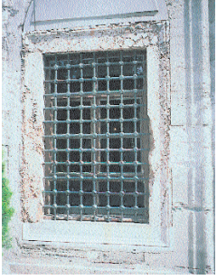
Resim 3; Siyavuş Paşa Türbesi'nin çözülmeğe başlayan pencere söveleri