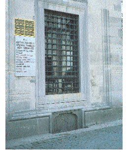
Resim 8; Sokollu Mehmet Paşa Türbesi'nde pencere kuruluşu