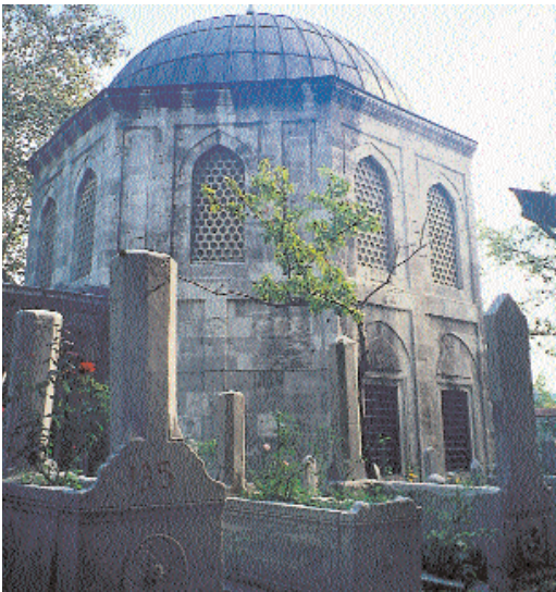
Resim 11; Zal Mahmut Paşa Türbesi