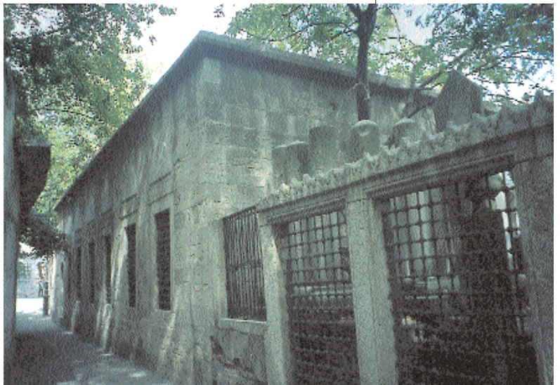
Resim 2; Pertev Paşa Türbesi

nen ve Yavuz Sultan Selim'in damadı olan bu kişi, Halep ve Mısır Beylerbeyliklerinde bulunduktan sonra 1556 yılında İstanbul'da ölmüş, ancak Eyüp'teki türbesinin yeri tespit edilememiştir. (4) Bazı araştırmacılar ise, Dukaginzâde Ahmet Paşa'ya ait bu türbe, Defterdar caddesi üzerinde, Şah Sultan Türbesi'nin arkasında bulunmaktadır. (5) Halen üstü açık bir hazireden ibaret olan ve on kbirden oluşan buradaki lahit taşlarının en eskisi, 1557 tarihli Ahmet Paşa'ya ait olanıdır. Bu hususta daha ayrıntılı incelemeye ihtiyaç bulunduğuna işaret etmek yerinde olacaktır.