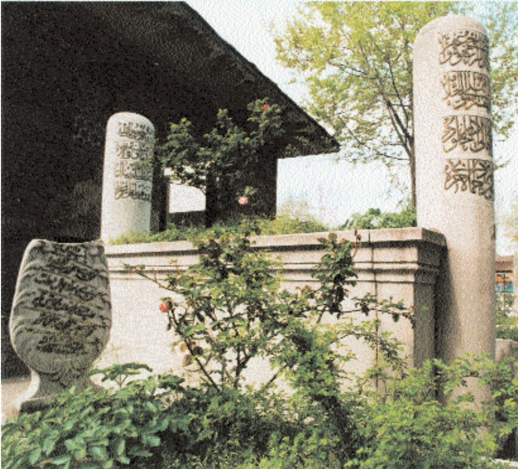
Fotoęraf 1; Ebussud haziresi iinde yer alan Ebussud kabri, Kazım Zaim, Belediye Arřivinden

gili okumaları saęlar. Edebiyat okumalarına tabi tutulan bir tař ise bize gemiř zamanlara ait řiir ve inřa estetięi ile edebiyat tarihini doęru tesbitte yardımcı olur. řehirlerin geirdięi evreler, tarihi bilinmeyen olayların tanımlanması, atalarımızın kimlik ve meslek gruplarının belirlenmesi, aile ve řecere bilgisinin tesbiti, eski aęların nfus politikaları, gemiř toplumların sosyolojik eęilimleri, geirdikleri salgın hastalıklar ile tabii fetler, tıp tarihine iliřkin veriler vs. hep mezarlıklarda dosyalanmıř bilgilerdir ve bunlar tarihin satır aralarını doldurmak iin bize kaynaklık eder. Oysa bugün mezarlıklarımız kapadı aılmamak zere kapatılmıř eski bir kitap gibi durmakta, prsmekte, yıpranmakta, eskimekte ve elden ıkmaktadır. Bir mezarlık, aynı zamanda bir tarih atlasıdır; milletlerin yařadıkları coęrafı mekanları en fazla onlar belirler. Tarihi coęrafyasına sadakat gstermeyen milletlerin topraklarının yaęmalanması da er veya ge kaınılmaz olacaktır. Mezarlıklarımızdan kaırılan her řahide, vatan topraęından bir paranın daha