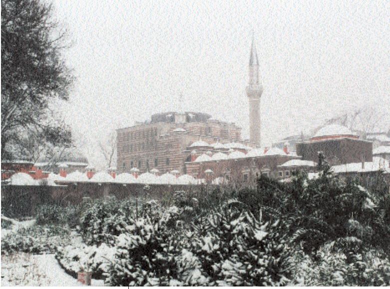
Fotoğraf 4; Zal Mahmud Paşa Camiinin kış görünümü