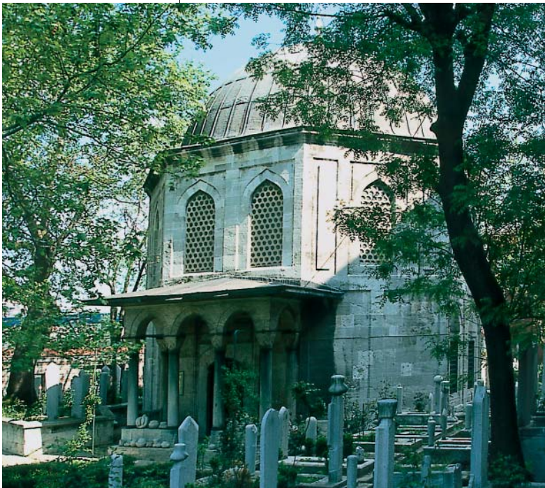
Fotoğraf 7; Zal Mahmut Paşa Türbesi ve haziresi, Kazim Zaim, Belediye Arşivinden

Sonraki yıllarda Evkaf Nezareti tarafından tutulan muhasebe defterlerinden Zal Mahmud Paşa ve Şahsultan vakıflarının varlığını Osmanlı Devletini sonuna kadar sür-