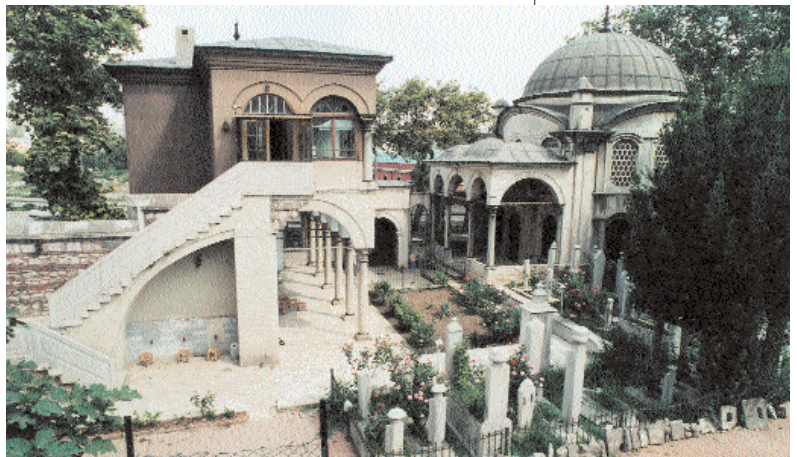
Fotoğraf 3; Şahsultan Türbesi ve Mektebi, Kazım Zaim, Belediye Arşivinden

5-Camii yakınlarında ve deniz sahilinde yirmi dört oda, altı dükkân ve bir mumhane