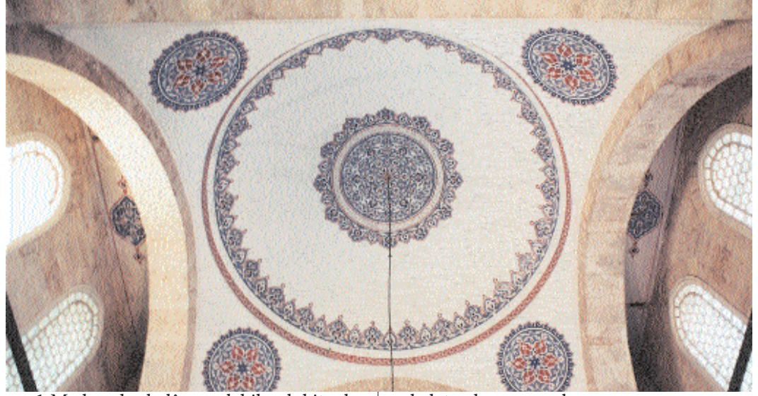
Fotoğraf 6; Zal Mahmut Paşa Türbesinin kubbe ve süslemeleri

1-Medreselerde lâzım olabilecek kitapların alınması ve kitapların muhafazası maksadıyla bir hâfız-ı kütüp tayin edilmesi.