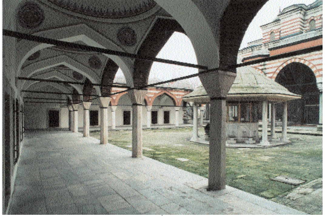
Fotoğraf 2; Zal Mahmut Paşa Camii ve Medresesi üst Şadrevanlı mekan

tir. 988/1580'de vefat eden Paşa'nın en mühim eseri aşağıda vakfiyesini zikredeceğimiz camii ve medresesidir .