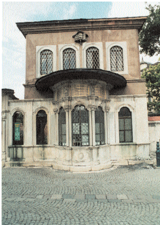
Fotoğraf 1; Şahsultan Mektebi ve Sebili

Diğer vâkıf Zal Mahmud Paşa ise Bosna'lı olup Enderun'da yetişmiş, Kanunî Sultan Süleyman zamanında çeşitli seferlere katılmıştır. 960/1552'deki Nahçıvan seferi sırasında Sultan Mustafa'nın Ereğli'de boğulması hadisesinde başrol oynadığından o tarihten itibaren Zal nâmı ile anılmaya başlamıştır. Ardından Kapıcıbaşı olan Paşa, sırası ile Halep ve Anadolu Beylerbeylikleri'nde bulunmuştur. 975/1568'de vezirlik rütbesine yükselmiş ve aynı yıl Şahsultan ile evlenmiş-