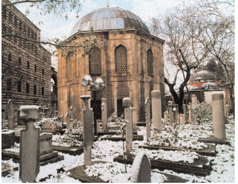
Fotoğraf 5; Zal Mahmud Paşa Türbesi ve haziresi