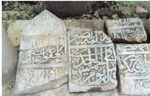
Fotoğraf 15; Erken döneme ait, kırık ve serbest durumdaki bazı mezar taşları.

Bundan sonra her mezar taşı için biçim, süsleme, yazı ve malzeme özellikleri ile kitabe çevirilerini içeren bir bilgi fişi hazırlanacak ve mezarın genel görünümü ile kitabelerini içeren fotoğraflar çekilecektir. Bu kapsamlı inceleme, mezarların sağlıklı bir dökümünü yapmamızı sağlayacağı gibi, dönem özelliklerinin ve statülerin mezar tasarımındaki etkilerini belirlememizi de sağlayacaktır. Öte yandan, harap durumda olan mezarların tespiti de yapılarak, acil müdahaleye ihtiyacı olan mezar taşlarının çoğu Türbeleri Koruma ve Yaşatma Derneği'nin maddi katkısıyla restore edilmişlerdir. Bizim kendi bünyemizde gerçekleştirdiğimiz bu çalışmanın İstanbul'daki tüm mezarlıklar bazında gerçekleştirilmesi gerekmekte olup bu proje, üniversitelerin bünyesinde oluşturulacak gruplarla, Kültür Bakanlığı veya Büyükşehir Belediye-