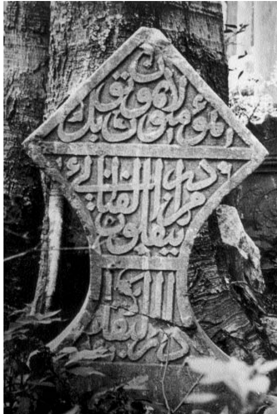
Fotoğraf 1; Mevlânâ Yakub oğlu Mevlânâ Muslihiddin mezarının genel görünüşü.