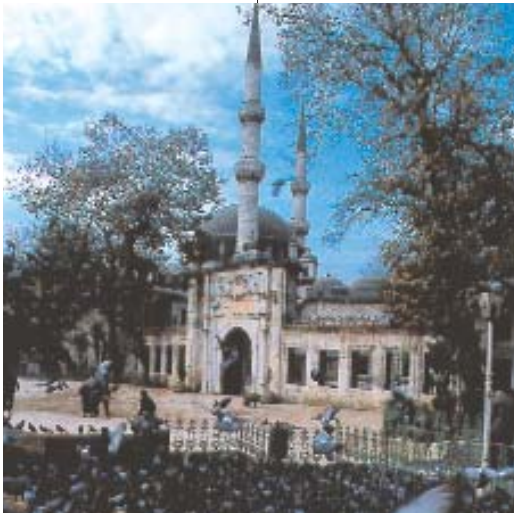
Resim 6; Haliç ve Eyüp'ten genel görünüş.