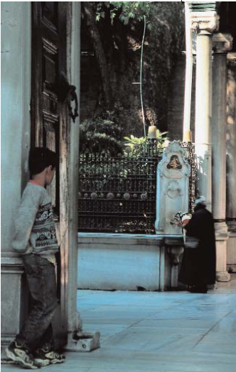
Resim 10; Hz. Halid türbesi karşısındaki çınar ve çeşmeler. (Firdevs Saylan)

"Pes, Kostantiniyye fetholdü. Sultan Muhammed Han, Ebû Eyyûb'un kabri şeriflerin Akşemseddin 'den iltimâs eyledi. Şeyh dahi ol kabri şerifi orman arasından bulup