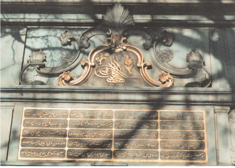
Resim 3; Eyüpsultan Cami Cümle kapısı girişindeki kitabe.

(4)İbn Hişâm, es-Sîre, II, 140-144; Semhûdî, Vefâ, I, 180-190; el-Belâzurî, Fütûhu'l-Büldân, s-20; el-Belâzurî, Fütûhu'l-Büldân, (çev. Mustafa Fayda), s.5-6; Mustafa el-A'zamî, Küttâbü'n-Nebî (sav), s.32.