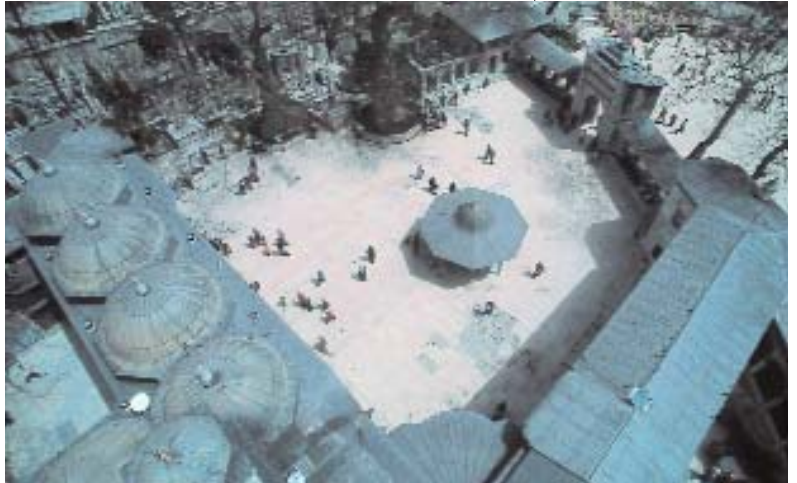
Resim 7; Eyyûb Külliyesi'nin üstten görünüşü.