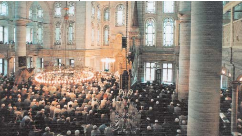
Resim 8; Eyyüb Camii için den bir görüntü. (Kazım Zaim)

İstanbul kuşatmasına da iştirak etmişti.