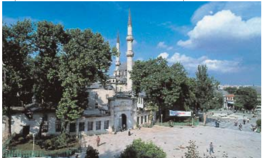
Resim 2; Eyyüb Sultan Camii' ve meydanı