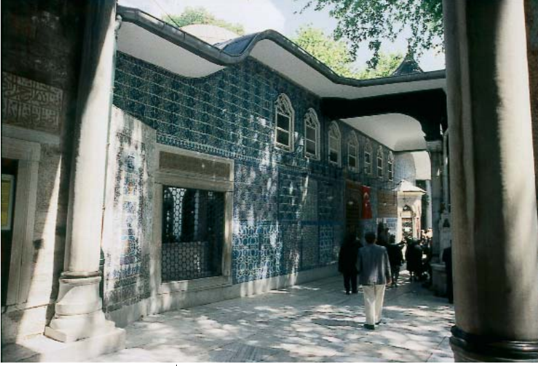
Resim 3; Hz Eyyüb El Ensari'nin türbesi (13)

üzeri küçük kubbecikler ile örtülü , yanları açık dar bir koridor ile avluya bağlanmıştır.