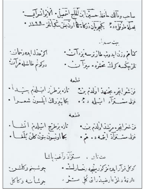
Resim 3; Ayvansarayî'nin el yazısı. Temellük kaydı (İ.Ü. Merkez Kütüphanesi, T.Y., No: 4566, 1b)