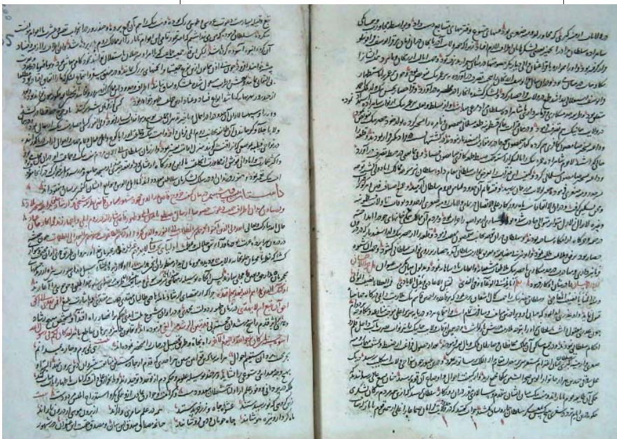
Resim 1; İdris-i Bitlisî'nin kendi hattıyla "Heşt Behişt" adlı eserinin iki sayfası (Süleymaniye Es'ad Efendi Kütüphanesi No: 2197)

Amcasının oğlu ile birlikte Hicaz'a geçen İdris-i Bitlisî Hacc vazifesini yerine getirdikten sonra, hakkı takdir edilmediği için İstanbul'a dönmeyip burada kalmaya karar verir, hatta bu konuda saraya bir mektupta gönderir. Ancak, bir süre sonra İdris-i Bitlisî mekke'de mücavir olarak bulunuyorken, 918/1512'de İstanbul'da saltanat değişikliği olur. II. Bayezid'in oğlu Trabzon valisi olan Yavuz Selim Han, babasını zorla tahttan indirerek, yerine tahta geçer. Yavuz Sultan Selim tahta geçmesinin ardından İdris-i Bitlisî'ye hediyeler yollayarak İstanbul'a davet eder. Bunun üzerine Mevlâna İdris Şam ve Halep üzerinden İskenderun'a gelir Şam ve Halep'te bir