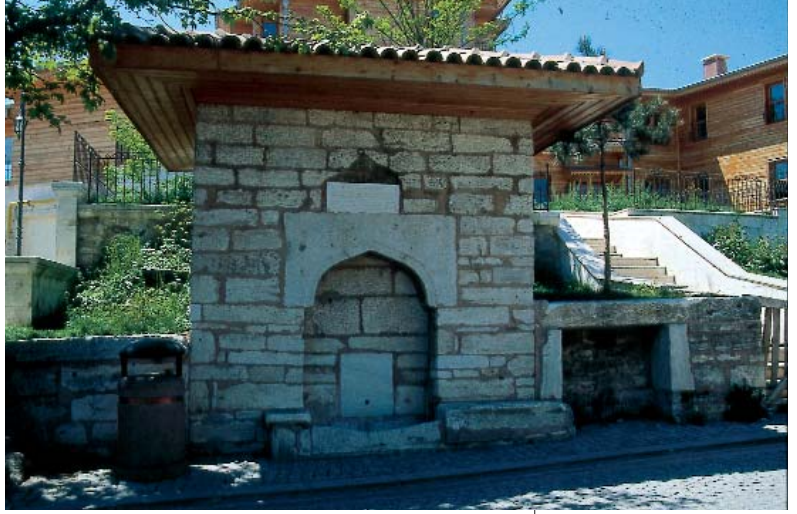
Resim 2; İdris-i Bitlisi Çeşmesi

İdris-i Bitlisi 1514'te Çaldıran seferine padişahla birlikte çıkar. Çaldıran seferi öncesinde, Şah İsmail Doğu Anadolu'da zaptettiği bölgelerdeki Kürt aşiret beylerini hapse attırmıştı. Bu durumla birlikte Kürt aşiretlerinin sünnî olmaları ve güçlü bir sünnî ulema geleneğinin, Abbasî hilâfet geleneğine köklü bir bağlılığın kürtler arasında yer edinmiş olması Kürt aşiretlerini Osmanlıya yöneltti. Bir kısım Kürt beyleri sefer yolculuğunda Yavuz Sultan Selim'in huzuruna çıkarak memleketlerinin tümünün Şah İsmail tarafından zabtedildiğini bildirerek bu konuda Şah İsmail'e karşı yardım talep ederler. Bu yüzden birçok Kürt aşireti Çaldıran savaşında Yavuz Sultan Selim'in safında savaşa katıldı. 2 Recep 920 tarihinde Çaldıran'da vukubulan savaş, bir hayli kayıp verilmesine rağmen kazanılır. Şah İsmail büyük bir bozguna uğrayarak ordusuyla kaçır, zevcelerinden biri ve birçok komutanı esir düşer. Çaldıran'da durmayan Yavuz Sultan Se-