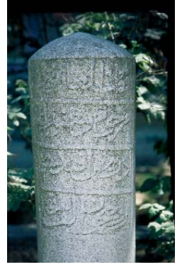
Resim 7; İdris-i Bitlisî'nin kitabesi

Ebu'l-Fazl Efendi'nin iki yetişkin çocuğu, kendisi henüz hayatta iken denizde akıntıya kapılarak boğulur. Şerefnâme'ye göre, Ebu'l-Fazl'ın bu iki çuğu fırtınalı bir günde, İstanbul yakasına geçmek için Galatadan gemiye binerler, ancak geminin batması sonucu, boğularak hayatlarını kaybederler. Bunu edebî bir dille ifade eden Şerefnâme'de bunlar hakkında manzum bir mersiye de yer alır. Şerefnâme'ye göre, Ebu'l-Fazl'ın başkaca erkek ço-