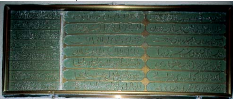
Resim 13; Zeyneb Hatun Camii'nin Tecdid kitâbeleri

Camiin aşağı tarafında ise, Türbe sokağının sol başında set üstünde, Zeynep Hatun'un demir parmaklıkla çevrili harap halde duran açık türbesi bulunmaktadır. Zeynep Hatun'un kabir şahidesi kaybolmuş olduğundan, kitabe ve tarih bulunamamakta ,bu yüzden vefat tarihi tesbit olunamamaktadır.Zeynep Hatun'un kabri yanında ise, ikisi şahideli olmak üzere üç kişinin daha kabri bulunmaktadır. Yine aynı yerde kitablesiz bir kuyu bileziği de