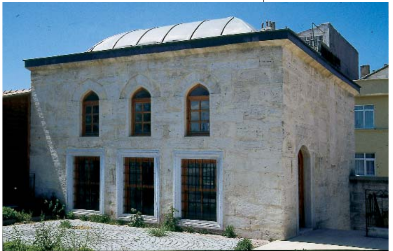
Resim 3; İdris-i Bitlisi Mektebi'nin arka taraftan görünüşü

lim ordusuyla Safevî ordusunu takip eder ve sonunda Tebriz şehrine girilir. Şah İsmail ise Şiraz taraflarına kaçır. Daha önce Şah İsmail'in zulmüne maruz kalan Tebriz halkı Osmanlıları sevinçle karşılarlar. Yavuz sultan Selim Tebriz'de dokuz gün kalır ondan sonra burada kalınıp kalınmayacağı hususu istişare edilir. Yavuz Sultan Selim, Tebriz ya da Karabağ'da kışlayıp, baharda tekrar Şah İsmail üzerine yürümeyi ve onu tümüyle kökten ortadan kaldırmayı hedefler. İdris-i Bitlisi burada kışlanmasını, daha sonra tekrar sefere devam edilmesi yönünde ısrar eder. Ancak vüzerâ ve yeniçeriler ise İstanbul'a geri dönmek konusunda ısrarlı olurlar. Hatta, neredeyse ayaklanmaya bile teşebbüs olunur. Yavuz Selim kargaşayı önlemek için geri dönmeyi kabul etmek zorunda kalır. Tebrizli bir kısım san'at ve ma'rifet erbabında yanlarına alarak , geri dönüş yolculuğuna çıkılır. Bayburt , Niksar ve Amasya üzerinden İstanbul'a dö-