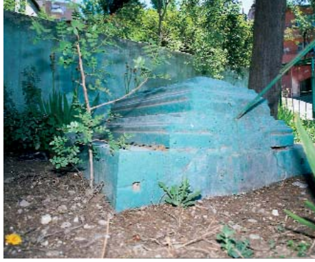
Resim 12; İdris-i Bitlisî'nin Zevcesi Zeyneb Hatun'un Kabri'nin bulunduğu küçük hazire