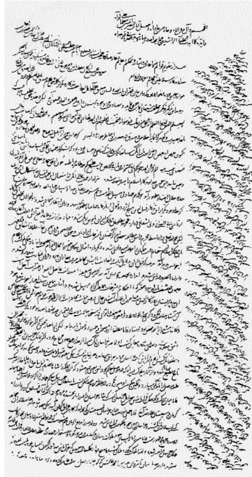
Resim 4; İdris-i Bitlisî'nin Yavuz Sultan Selim'e gönderdiği mektub

(8) İdris-i Bitlisî'nin en önemli siyasi rolü, kürt aşiretlerini ve Kürdistan havâlisini Osmanlılara bağlamak olmuştur. Daha önce akkoyunlular'ın hakimiyet sahaları içinde bulunan bölge halkı, Safevî Devleti kurulunca bu yeni Şii devletin baskısına maruz kalırlar. Abasî devrinin başlarından beri sünnî akideye bağlı bulunan ve güçlü bir ulema geleneğine sahip olan kürtler, safevîlere karşın direnmek durumunda kalırlar. Bu suretle İdris-i Bitlisî'nin dirayetli siyaseti ve tavassutu ile Osmanlı'ya tercih ederler. Böylece, bölge halkı Tebriz yerine İstanbul'u payitaht olarak görmeyi tercih ederler. Çünkü, Yavuz Sultan Selim bölgedeki, beylerin haklarını muhafaza etmiş memleketlerini, Şah İsmail'in aksine beylere iade ederek muhtariyet tanımış. Sonuçta Bölge halkı safevî saldırı ve baskılarından korunmuş olur, aynı zamanda da, Safevî akınlara karşı tampon görevini icra ederler. Böylelikle safevîlerin Anadolu'nun içlerine ve batı bölgelerine sızmaları ve nüfuz göstermelerinin de yolu kapatılmıştır.