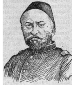
Resim 1; Halil Rıfat Paşa (Türk Meşhurları İ.A.Gövsa, s.165)

Türbesi Eyüp'de Bostan iskelesi Sokağı ile Boyacı sokağının birleştiği köşededir. Türbe girişi Boyacı Sokağa bakan cephede bulunan çift kanatlı demir kapıdan sağlanır. Kapıdan girilen dar koridorun sağ tarafında ortadaki mutfak olmak üzere, lojman olarak kullanıldığı ifade edilen üç odalı bölüm bulunur. Bu günkü hali ile demir kapıdan içeriye girildikten sonra hemen soldaki ilk açıklık ile türbe içine geçiş sağlanır. Halil Rıfat Paşa'nın olduğu kabul edilen sanduka ile birlikte söz konusu mekanda toplam dört sanduka vardır. Üzerlerinde hiçbir tarih ve kitabe bulunmayan ahşap sandukalardan