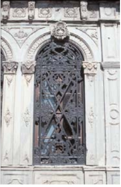
Resim 3; Halil Rifat Paşa türbesinin Pencere şebekesi Resim 4; Halil Rifat Paşa türbesinin Boyacı sokaktan Bostan iskelesi sokağına dönen köşesi