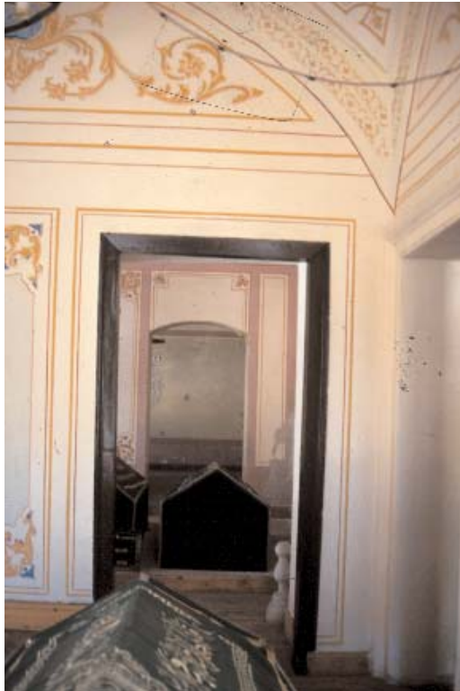
Resim 6; Halil Rifat Paşa türbesi içinden Mahmud Celaleddin paşa ve Hüsrev paşa türbelerine bakış

Kapısı Boyacı sokağına bakan türbe kubbe ile örtülü ve yapının dış cepheleri tamamen mermer kaplıdır. Boyacı sokak ile Bostan is-