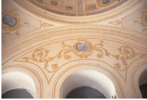
Resim 7; Halil Rıfat Paşa'nın Türbe içindeki kabri (sandukası)

kelesi sokağının kesiştiği yerde ve halîç tarafındaki köşede yer alan türbenin köşesi sokağın konumundan dolayı pahlanarak yumuşak bir dönüş oluşturulmuştur. Yapı dış cephesindeki yoğun taş kabartma plastik görünümü ile ampir üslup yansıtmaktadır. Sokağa bakan her iki cephede de dar ve yüksek tasarlanmış üçer pencere bulunur. Pencereleer yuvarlak kemerlidir ve demir döküm şebekeleri vardır. Çift kanatlı demir kapı duvarı cepheden içe kaymıştır. Kapı kanatları üzerinde dörtgen panolar içerisinde Çelenk, rozed bitkisel köşe dolgu motifleri bulunur. Ayrıca kapısının sağ tarafında penceresi örülmüş türbedar(?) odası vardır. Yapının alt kenarlarını her iki cephede dolanan mermer levhalar üzerinde stilize edilmiş istiridye kabuğu şeklinde kabartmalar bulunur. Pencere aralıklarında oluşan ikiz dikmelerin üzerinde barok kıvrımlardan oluşan madalyonlar ile başlık kısımlarında istiridye kabuğu, girland, fyonk ve akant yapraklarından oluşan motifler vardır. Kemerlerde yumurta firizleri, kilit taşlarında ise plastr şeklinde