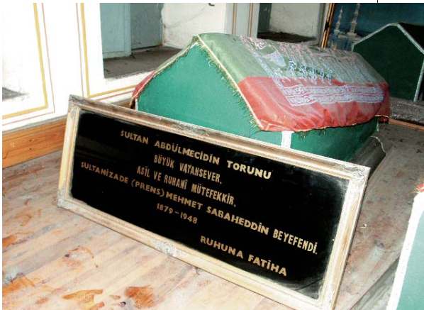
Resim 12; Prens Sabahattin'in sandukasının içinde bulunduğu Eyüp'teki tarihi yapı