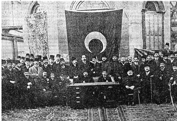
Resim 6; Prens Sabahaddin bir törende masada sağda

(1) Ege, Nezahat Nurettin, Prens Sabahattin, Hayatı ve İlmî Müdafaaları , Fakülteler Matbaası, İst. 1977.