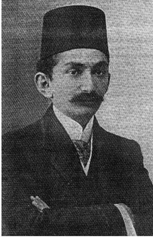
Resim 1; 1908 de Meşrutiyetin ilanı tarihindeki Prens Sabahattin'in fotoğrafı.

Prens Sabahattin ve Ahmet Rıza etrafında ortaya çıkan fikir ayrılıkları sebebiyle arzu edilen sonuca ulaşılamayan kong-