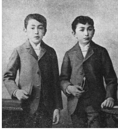
Resim 4; Prens Sabahaddin 1899 senesinde Avrupa'ya ilk gidişinde (C. O. Tütengil, Prens Sabahattin, 1954)