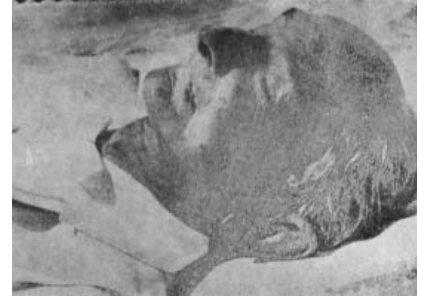
Resim 10; Prens Sabahattin ölüm döşeginde (8 Temmuz 1948 Berne)

Sabahattin, İttihat ve Terakki Cemiyetine Açık Mektuplar: Mesleğimiz Hakkında Üçüncü ve Son Bir İzah, İst. 1327 (1911-12), 44 sf.