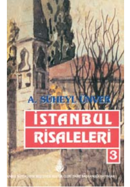
Resim 2; Süheyl Ünver'in Büyükşehir Belediyesi tarafından basılan risaleleri'nin kapağı.