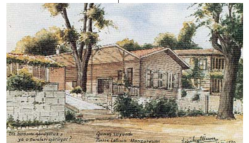
Resim 3; Süheyl Ünver'in sulu boya çalışmasında Peyir Loti kahvesi (Sevdiğim İstanbul)