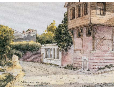
Resim 5; Eyüb Sultan'da Baba Haydar'da Şeyhülislam Tekyesi Şeyh dairesi.