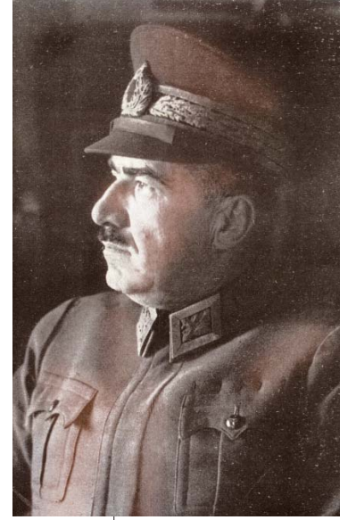
Resim 3; Mareşal Fevzi Çakmak Cumhuriyet dönemi Mareşal üniforması ile

Fevzi Paşa artık kişiliği, askeri bilgisi, lider komutan nitelikleri ile Milli Mücadele’nin en ön saflarında ordunun her türlü teşkilatlanma, düzenleme, sevk ve idari, disiplin ve lojistik konularında lider kadrosu arasındaki yerini almıştır. 9-10 Ocak 1921 Birinci İnönü Savaşı. Cephane kıt, mahrumiyet alabildiğince. Garp Cephesi Komutanı İsmet