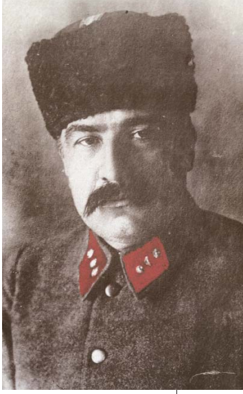
Resim 2; Mareşal Fevzi Çakmak Sakarya Savaşı sonrası 1921 de Ferik (Orgeneral) üniforması ile

rünmüş ve Sultan Abdülhamid II. nin istibdadını yıkarak devlet yönetimini ele geçirmek için çalışmalarına başlamıştır. Bu çalışmaların içinde sivil kesimden çeşitli devlet adamlarını, tüccarları, vilayet ve sancakların eşraf ve ileri gelenlerini, Asker kesimden üst rütbeli komutanları kutsallığına inandırdıkları cemiyet prensiplerini benimseyen subayları da üye yaparak cemiyete kazandırma faaliyetleri de vardır.