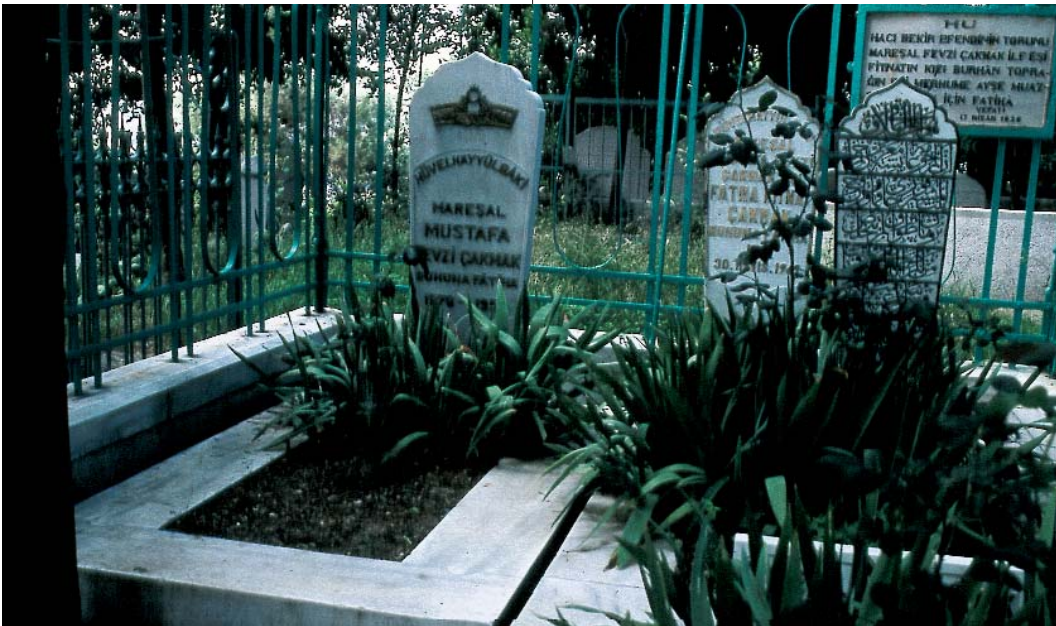
Resim 8; Mareşal Fevzi Çakmak'ın Eyüp'teki kabri