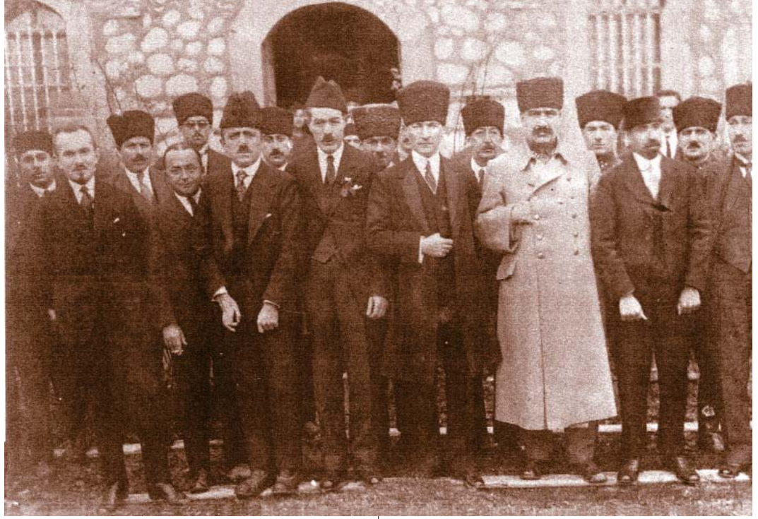
Resim 7; Azerbaycan ve sovyet delgeleri ile birlikte. Resimde Dışişleri Bakanı Yusuf Kemal Bey, Atatük, Mareşal Fevzi Çakmak ve sağ başta Fethi Okyar görülmektedir.

9 Ekim 1917'de Filistin Cephesindeki 7. Ordu Komutanlığına atandı. Sonraları hastalanarak tedavi için İstanbul'a gitti. Yerine 7 Ağustos 1918'de, o sırada Genel Karargâh emrinde bulunan Mirliya Mustafa Kemal (ATATÜRK) Paşa tayin edildi.