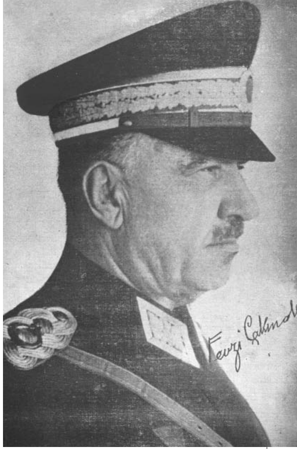
Resim 5; Kara Harp Okulu'na imzalayarak verdiği Mareşal üniformalı fotoğraf.

çevirir. Çankaya'daki köşkünde küskünlük günleri başlar. O'na göre askerlikte ihtiyarlayan, işe yaramayan adamın politikada hizmeti olabilir mi?