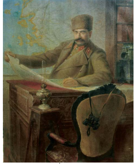
Resim 1; Mareşal Fevzi Çakmak'ın ressam Hüseyin Avni Lifij tarafından 1923 yılında yapılan yağlıboya resmi.

1889 yılı Mayıs ayında Gülhane Askeri Tıbbiyesinde temeli atılan ittihat Terakki Cemiyeti giderek bir siyasal parti kimliğine bü-