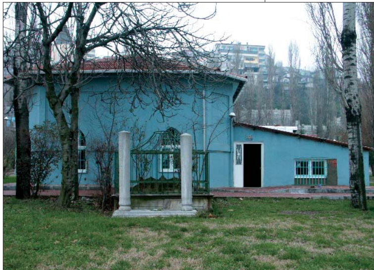
Resim 4; Bahariye Mevlevi-hanesi Mescidi ve Haziresi kalanlar.

Yukarıda zikredilen ikinci beyit, günümüz Türkçe'sine "Gam lokması boğazıma dizildi. Bunun içindir ki içki şimdi bana annemin sütü kadar helal sayılır." biçiminde çevrilebilir. Beytin nüktesi, o devrin dindar ortamında hemen herkesin bildiği şu fıkıh kuralıyla ilgilidir: "Lokma boğazda kalır da yakında su da bulunmazsa, boğulmamak için o anda içkiyi içmek şer'an helaldir." Şair, boğazının dizilen gam lokmasının içkiyi kendisine helal saydıracak kadar peklik gösterdiğini ve yutkunamaz olduğunu, nihayet nefesinin kesilme noktasına geldiğini, eğer elinin altında hazır bulunan içkiyi içmezse