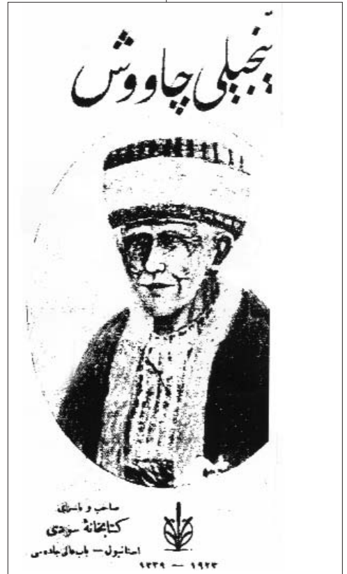
Resim 1; İncili Çavuş kitap kapağı

İncili Çavuş'un iyi bir öğrenim gördüğü Arapça ve Farsça bildiği muhtelif kaynaklarda zikredilmektedir