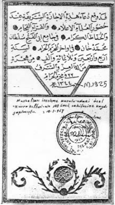
Resim 3; Hafızlık icazetnamesinin son iki sayfası