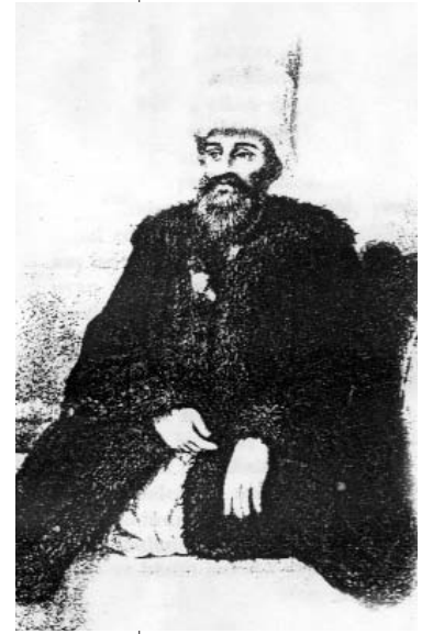
Resim 1; Darendeli İzzet Mehmet Paşa

İzzet Mehmet İzzet Mehmet Paşa, Müttefik devletler tarafından Navarin'de yakılan Osmanlı donanmasının yerine düşmana karşı çıkacak bir donanmanın bulunmaması nedeni ile maiyeti ve bahriye askerinden toplam üç bin kişilik bir kuvvetle kara tarafından Varna tarafına gönderildi. Rus saldırısına karşı dört ay kadar direnerek 10.000'i aşkın askeriyle Varna'yı kuşatan Rusları