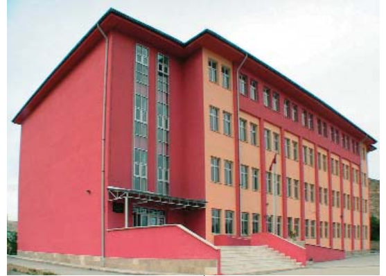
Resim 5; Darende İzzet Mehmet Paşa İlköğretim Okulu

Tarih-i Lütfi, Dersaadet 1306, c. 7, s. 21.