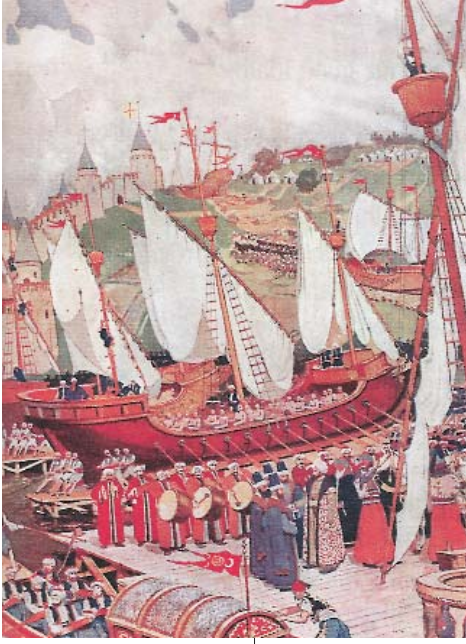
Resim 5; Naci Kalmukoğlu'nun fırçasından Fatih'in tekneleri (Popüler Tarih, Mayıs 2003, S. 47)