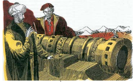
Resim 6; Top dökümcüsü Urban ile Fatih Sultan Mehmed (Popüler Tarih, Mayıs 2003, S. 57)

"Dünya harikası İstanbul Şehri" ni zikredip, zihninde tarihin hoş bir noktasına yolculuk yapmayan, içinde hafif de olsa 29 Mayıs 1453'ün ihtişamlı atmosferinin coşkusunu hissetmeyen Türk insanı yoktur.