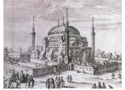
Resim 3; Ayasofya gravürü (İstanbul, İTO, s.99)

Hisarın yapımının bu şekilde gerçekleşmesi ana kaynaklarda geçmemektedir. Buradaki olağanüstülükler halk muhayyilesinden doğan rivayetlerden ileri gelmektedir. Böylece tarihi bir olay olan hisarın yapımı efsanevi bir mahiyet kazanmıştır (Derman Boyladı, Efsaneler Dünyasında Ana