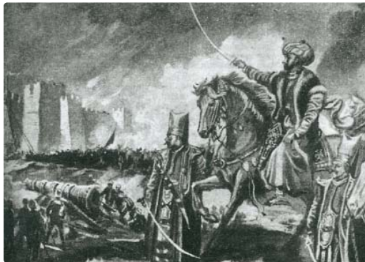
Resim 1; Müniş Fehim'in çizgi- leriyle, Fatih ve topları (Popüler Tarih, Mayıs 2003, S. 58)

Sultan Mehmed'in Türk kuşatmasının en küçük bir sarsıntı geçirmemesi için geceler boyu uykusuz, ayakta kalarak gösterdiği yüksek dayanıklılık, kuşatmanın hummalı bir noktasında atını denize sürmekle gösterdiği gözü karalık, sırrını "Sakalının telinden bile gizleye