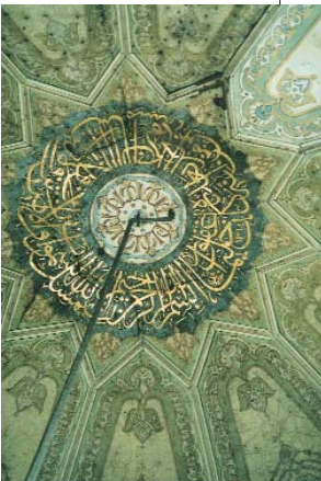
Resim 12-13; Kaptan Paşa Camisinin kubbesinden kitabe ve süslemeler.

Mihrişah Sultan'ın Arif Ağa'nın başmimarlığı sırasında 1208 (1793) yılında inşa edilen dolap kapakları, kapı kanatlarındaki yalın ifadeli süslemeleri ve yeni biçimleri ile dikkat çeken, Mihrişah Sultan imaretiyle birlikte yapılan, (5) Mihrişah Sultan Türbesi'dir. Bu türbede dört sanduka parmaklığı yer almaktadır. Bunlardan üçü sedef mozaik biri ise sedef kakma yanı sıra bir tür yüzey üstü kapama ya da yüzey üstü tutturma kapsamında ele alınabilecek ve boncuk tutturma olarak isimlendirilebilecek bir uygulama ile bezenmiştir. İstanbul Yahya Efendi Türbesi'ndeki parmaklıkları çağrıştıran Perestü Sultan sandukasının parmaklığı rozet çiçeği biçiminde sedeflerin renkli boncuklarla yüzeye tutturulmasıyla bezenmiş tekniğiyle günümüze değin kaydedilmemiş bir örnek olması açısından büyük değer taşımaktadır. Sedef pullarla mozaik tekniği ile bezenmiş,