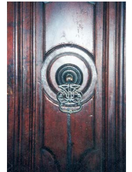
Resim 2; Eyüpsultan Camisinin hünkar mahfili kapısından ayrıntı.

muş dikdörtgenlerden gelişen kompozisyonlarıyla dikkat çekmekte ve Klasik Dönemin özellikleriyle bir gurubun ilgi çeken parçalarını oluşturmaktadır. Sonradan kahverengi yağlı boya ile boyanmış parmakçalığı delik işi, gövdesini oluşturan bazı tablaları künde kari uygulanmış sonsuza açılan yıldız motifinden gelişen kompozisyonlarla bezenmiş Zal Mahmut Paşa Cami vaaz kürsüsü ise 16. yüzyıl vaaz kürsüleri arasında bir boşluğu doldurmaktadır. Benzer bir olgu Eyüpsultan Türbesi'nin Fatih Dönemi'nden kalmış olduğu ileri sürülen (1) yapının çıkışında yer alan bir çift kapı kanadı için söz konusudur. Bir kanadı 227 cm.yüksekliğinde, 68 cm.genişliğinde ve 4 cm. kalınlığındaki bu kapı kanatları dikdörtgen biçimli üçer tabladan oluşmaktadır. Bu tablalar seren ve kayıtların arasına üstte ve altta yatay ortada ise dikey oturtulmuştur. Üst tablalar yalın ağaç-