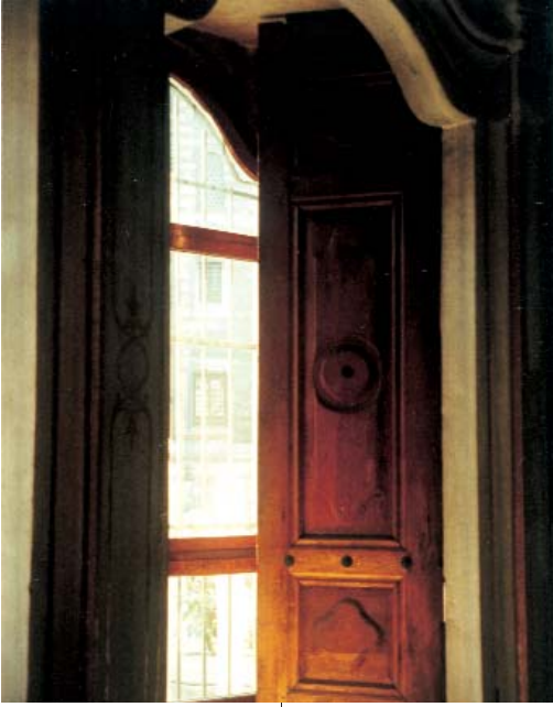
Resim 10; Şah Sultan Türbesi'nden bir pencere kapağı.