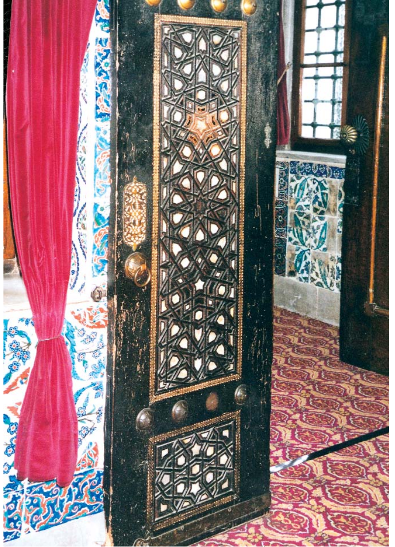
Resim 1; Eyüpsultan Türbesi'ndeki kapı.

Bilindiği gibi Eyüpsultan'da Fatih'in yaptığı camiden günümüze ağaç işi örneği ulaşmamıştır. Klasik Dönemden ulaşan belli başlı parçalar Mimar Sinan'ın 1577 de inşa ettiği Zal Mahmut Paşa Camisinin pencere kapakları, kapı kanatları, vaiz kürsüsü ile Zal Mahmut Paşa, Sokollu, Siyavuş, Ferhat Paşa vb. gibi türbelerin pencere kapakları, kapı kanatları ile Mimar Dalgıç Ahmet Paşa'nın yapmış olduğu ve 1623 yılında Nakkaş Hasan Paşa'nın gömüldüğü türbesinin kapı kanatlarıdır. Bu parçalardan pencere ve kapı kanatları hem tablalarında uygulanan künde kari ve oyma tekniği yanı sıra seren ve kayıtlarında gözlenen kaplama tekniği ile hem de ya sonsuza açılan yıldız motiflerinden gelişen ya da değişik yönlerde oturtul-