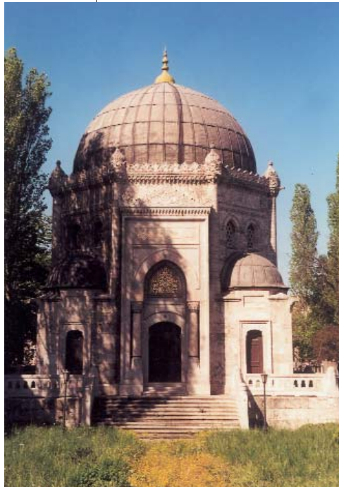
Resim 16-17; Sultan Reşat Türbesinin ön cephesi ve orta kapısından ayrıntı.