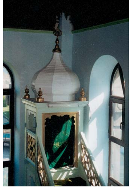
Resim 14; Kaptan Paşa Camisinin vaiz kürsüsü.

Altıncı yapı ise Mimar Kemalettin'in yaptığı ve kitabelerinden 1332(1913-14 M)de tamamlandığı düşünülen Sultan Reşat Türbesi'dir. (10) Türbenin ön cephesini bezeyen üç kapı bir imparatorluğun bu semtte verdiği son örneklerdendir. Buradaki tek kanatlı ve çift kanatlı, üçer tablalı, yalın ifadeli kapı kanatları milli mimari olarak isimlendirilen bir dönemin örnekleri olması açısından kayda değer.