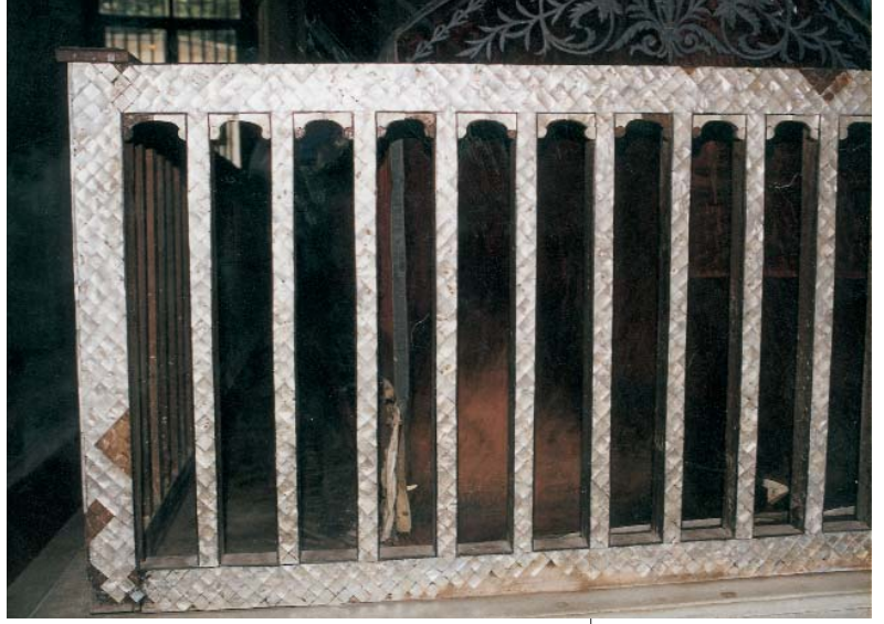
Resim 7; Mihrişah Sultan'ın sandukasını kuşatan parmaklık-ğından ayrıntı.

İkinci yapı caminin yanındaki Eyü Sultan Türbesi'dir. Burada I.Apđülhamid'in bronzdan yaptırmış olduğu kapının önünde yer alan II.Apđülhamid'in kendi yaparak vakfettiği (Türbeler Müzesi Env.N.172) (4) parmaklık biçiminde tasarlanmış bir çarpma kapı bulunmaktadır. Tek kanadı 109 cm.yükseklüğünde ,63 cm. genişliğinde olan köşelerde ve ortada 8 cm. yüksekliğinde yarım palmetlerle taçlanmış kanatlar iki seren arasına üç kayıtlı tuturulan dört çubuktan oluşmaktadır. Dikdörtgen biçimli kanatların yüzeyi yan yana yapıştırılmış pul sedeflerle bir tür mozaik tekniği ile bezenmiştir. Çu-