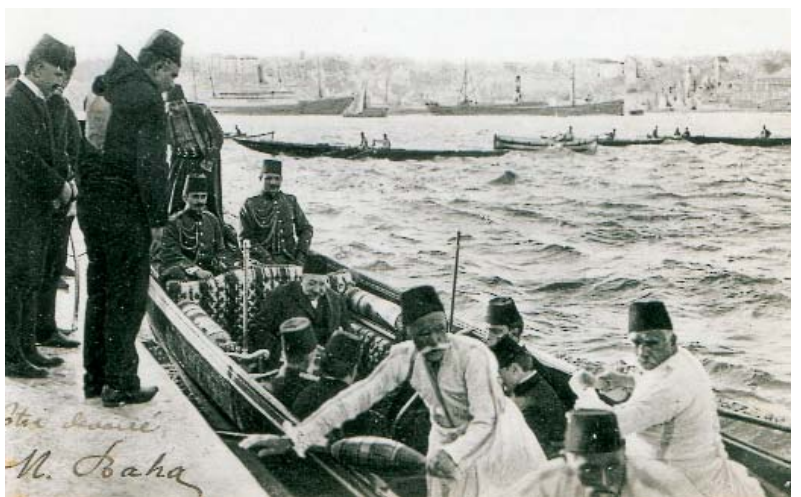
Resim 5; Sultan Reşat, Bostan İskeleyi (Eyüp Belediye arşivinden)