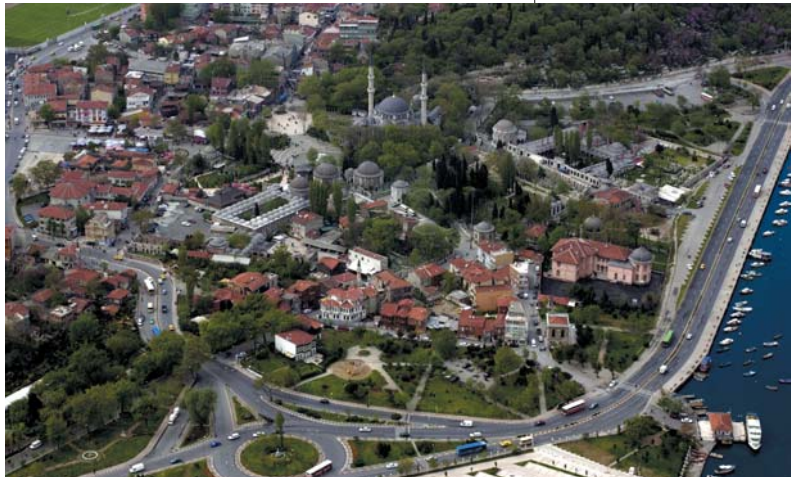
Resim 2; Eyüp ve Eyüpsultan Külliyesi, 2001