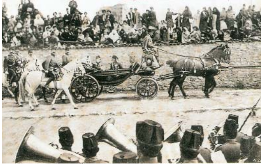
Resim 9; Sultan Reşat, Cuma Selamlığı, Kartpostal

İnanç ve Kültür Turizmi ile Dinlerarası Diyalog ve Hoşgörü başlıkları, kelimeler itibariyle birbirinden ayrı ve farklı görünseler bile, konjonktürel olarak düşünüldüğünde âdeta aynı mananın müteradifi gibi algılanmaktadır. Bu tebliğde, zaten Müslüman