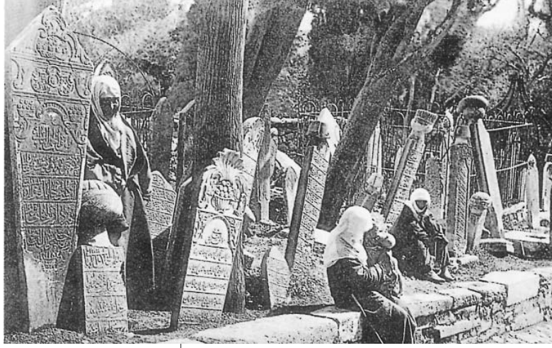
Resim 4; Eyüp Mezarlığı, Piyer Loti Tepesi, Kartpostal

Fetih meş'alesinin simgesi sayılmaktadır. Buradaki Türbe, Cami ve Külliye onun manevî varlığını mücessen hale getirmiştir. Bu bağlamda, Ebu Eyyub el-Ensârî'yi İstanbul'un fethine sevkeden iman cevherinin iyi anlaşılması ve değerlendirilmesine bugün her zamankinden daha fazla ihtiyaç vardır (13) .