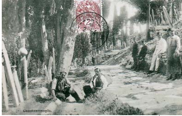
Resim 7; Eyüp Mezarlığı (İstanbul M.Halit Bayrı, İstanbul-1951)