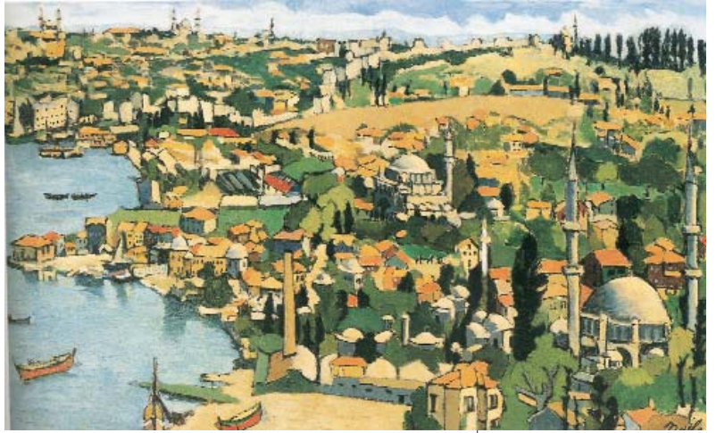
Resim 1; Naile Akıncı-1954 S.81 Ocak 2001 İstanbul

Eyüp en parlak günlerini Lâle Devri'nde yaşamıştır. Haliç kıyıları boyunca serpiştiril-