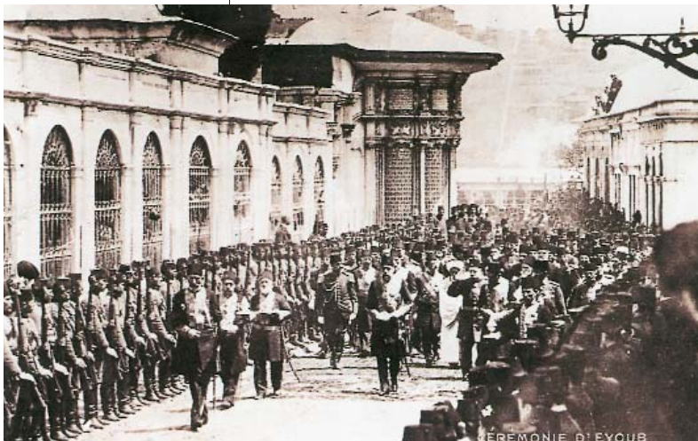
Resim 3; Sultan Reşat ve Kılıç Kuşanma Merasimi

Eyüp'ün maddî ve manevî tarihini bu hadis-i şerifin manalandırdığı maneviyat iklimine dayanarak açıklamaya çalışan ilim adamları haksız değildir; çünkü Hz.Eyüb el-Ensârî, Fetih heyecanı ve Rasulullah'ın müjdesine lâyık olmak için günlerce uzaklıktaki çöllerden koşup geldiği İstanbul surları önünde şehit düşmüş ve kendi adıyla anılan Eyüp'e damgasını vurmuş bulunmaktadır. İşte bu açıdan Eyüpsultan Arap dünyası için özel bir anlam ifade etmekte ve