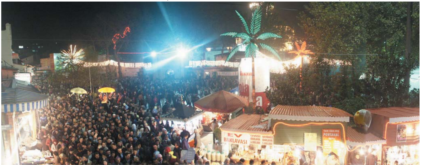
Resim 10; Ramazan gecelerinden birinde Eyüpsultan meydanı

Eyüp, son yılların revaçta olan söylemi ile İnanç ve Kültür Turizmi'ndeki yerini, bir bütün halinde yapılanmak suretiyle bir an önce almalıdır. Başta sayın başkan olmak üzere Eyüp için çalışanlarının bu yoldaki gayretleri şükranla izlenmektedir. Anadolu insanının zihin ve kalbinde Eyüpsultan'ın ayrı bir yeri ve önemi vardır. Anadolu'nun ücra bir köşesinden kilometrelerce yol kat ederek sadece Türbe'yi ziyaret etmek ve Cami'inde bir vakit namazı kılmak için buraya gelenlerin bulunduğu herkesin bildiği bir gerçektir. Küreselleşmenin getirdiği yeni imkânlarla Eyüpsultan'ı dünyanın gözde beldelerden biri haline getirmek hiç de zor olmayacaktır.