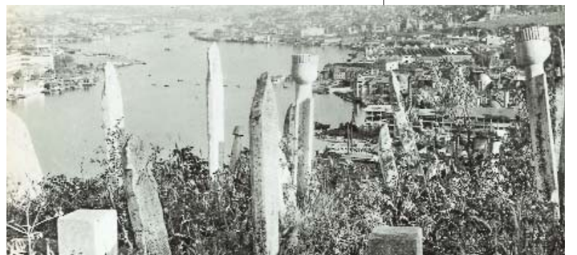
Resim 6; Eyyûb Piyerloti (İstanbul, Atlantis, Martin Hürlimann, S. 112)

Anadolu bir bahçe; İstanbul bu bahçenin başında görkemli bir saray; Çanakkale ve İstanbul boğazları bu bahçeli sarayın dünyaya açılan kapıları; buraların hakimiyeti, bu kapıların anahtarının elde bulundurulması; başta Hz. Ebû Eyyûb el-Ensari ve Fatih olmak üzere nice sahabe, sultan, şüheda, ulema ve evliya bu bahçeli sarayın manevi bekçileri; millet ile bütünleşen askerler, polisler ve diğer güvenlik görevlileri de onun maddi ve aktif bekçileri; nice cami, minare, mescid ve medreseler ve diğer İslâmî eserler bu sarayın tapuları mesabesindedir. Allah bizi İstanbul'dan ve İstanbul'u bizden ayırmasın! Bu mülk-ü millete, bu din-ü devlete zeval vermesin!