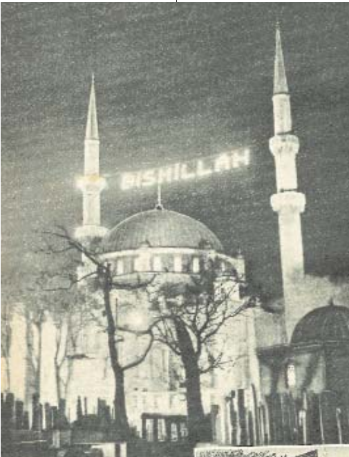
Resim 4; Eyüpsultan Camii (İstanbul, Mehmet Halit Bayrı, S. 90)

Sırf ilmi gerçeklere ulaşmak ve mevzû hadisleri ayıklamak gayesiyle yapılan araştırma ve yorumlardan endişeye mahal yoktur. Gerçekten de Hız. İsa'nın nüzûlü, Deccal'in ve Mehdi'nin çıkışı ile ilgili haberler, Kur'an