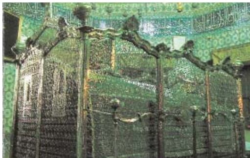
Resim 2; Ebu Eyyub el-Ensari'nin türbesinin içten görünüşü (700. yıl'da İstanbul'daki Mimarî Eserler, s. 93, İstanbul Valiliği, 2000)