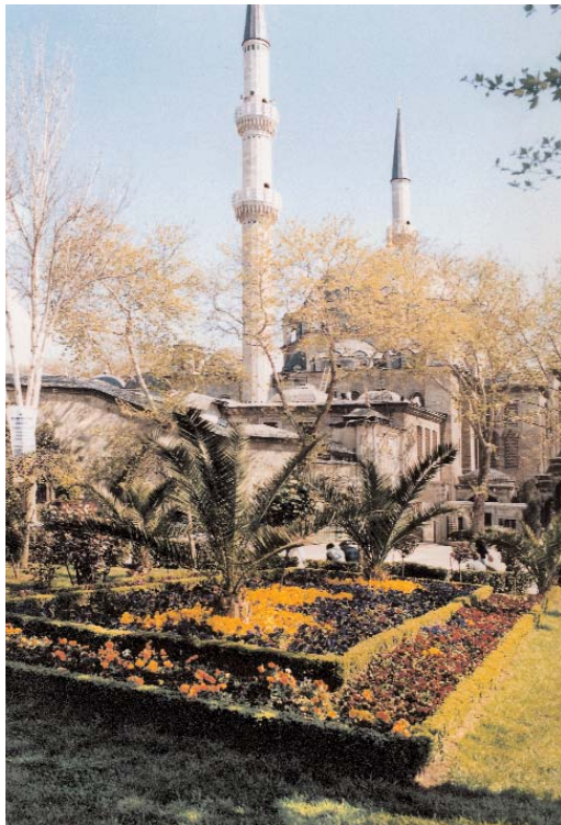
Resim 5; Eyüpsultan Camisi