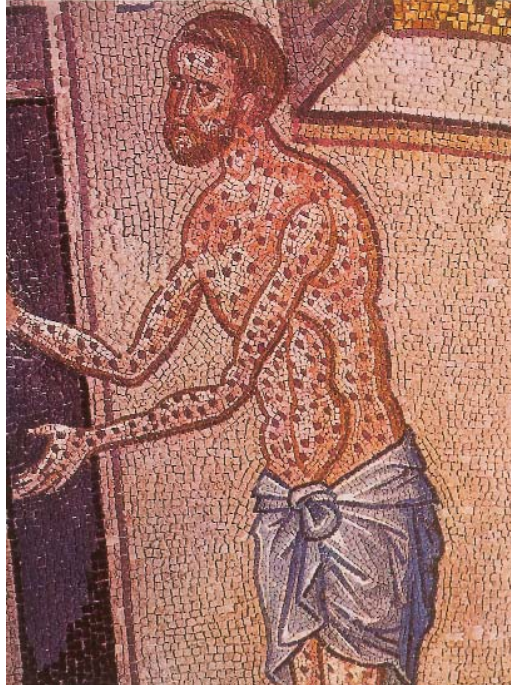
Resim 4- İsa'nın cüz zamlyı iyileştirmesi mucizesi, Kariye Müzesi, İç narteks mozaiklerinden ayrıntı, 14.yüzyıl.