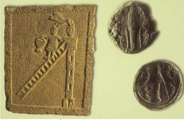
Resim 9- Aziz Simeon Styli-tes'e adanmış bazalttan kabartma stel, Şam Ulusal Müzesi, 5.-6.yüzyıl ile üzerinde azizin tasvirleri olan eulogia'lar.

re, bazen de gösterdikleri mucizeleri kapsayan kompozisyonlarla verilmiştir. Yaygın olarak Kosmas, Damianos, Panteleimon ve Hermolaos'un tasvirleri yapılmıştır. Bazı yapılarda ise tüm hekim azizler birlikte, yan yana sıralanırken gösterilmişlerdir.