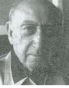
Resim 15; Fazıl Hüsnü Dağlarca

Delikanlım, İşâret aldığım gün atandan Yürüyeceksin... millet yürüyecek arkandan! Sana selâm getirdim Ulubadlı Hasan'dan... Sen ki burçlara bayrak olacak kumaştasın; Fâtih'in İstanbul'u fethettiği yaştasın!