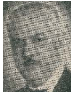
Resim 10; Mithat Cemal Kuntay