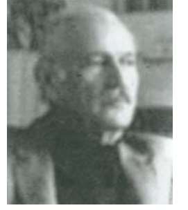
Resim 16; Oktay Rifat

Türkçeyle dolmuştu sokaklarım, ormanlarım, Havada şekli vardı bir sonsuzluk türküsünün. Sanatım insanlığım yeniden dile gelmişti, bir erkeklikle, Ardından, devirler örtüsünün. Vardım sırrına, Türkçenin, kâinat gürültüsünün. Sesleniyordu denize, burçlardan, bir yeniçeri