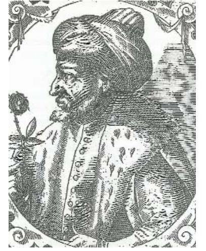
Resim 1; Gül koklayan Fatih, Gravür

Onun psikolojisine ait söylenmiş ve söylenecek şeylerden daha çok, onu ifade eden kendi sözleri veya ona yakıştırılan sözler önemlidir. Kararlılığını ifade için nakledilen, "Ya ben Bizans'ı alırım, ya Bizans beni!" sözü pek çok rivâyetten önemli. Babasıyla saltanat meselesine dair konuştukları ile ilgili rivâyetler, gerçek olmasa da Fatih'in halk nezdindeki portresini ifade edecek nitelikte. Sahn-ı Seman Medresesi'nde kendisi için oda istediğinde, müderrislerin onu imtihana tâbi tutma tekliflerini kabul edip öyle oda hakkı edinmesi, yanlışlıkla haksızlık ettiği Rum mimarın onu mahkemeye verdiğinde dâvacı ile aynı hizada oturmayı kabul ettiğine ait rivâyetler, onun kanunnamesiz iş yapmayan âdil padişah portresini tamamlıyor. Devrinin önemli pek çok âlim ve sanatkârını çevresine toplayan, entelektüel merakları olan, tasav-