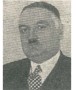
Resim 9; Yahya Kemal