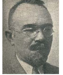
Resim 5; Aynî

"Kurulup sebz-zâr içre otağı Müşerref eyleye bağ ile râğı O mecma'da idiü tedbîr-i ma'kûl Bula Konstaniyye fethine yol Benefşe şeş-perin almış eline Takınmış tığını süsen beline Dizüp çekmiş çemen içre sunûfun Şeh-i devrâne arz etmiş sufûfun Azeb-veş sürh bürkin giydi lâle Şakâik-i gürzini itdi havâle Gül-i ahmer siper çekmiş yüzine Gözükmez gonce peykânı gözine Karanfil rümh-i sebze dikdi bir baş Görenler didiler tahsîn ü şabaş Sabâ olmuş tâli'a gözcü nergis Ki yol bulmaya ol orduya her has Götürdü önce ak sancağı zambak Mükemmel oldu ol sancakla revnak Çınar açmış elineyler duâyı Bunu der kim İlâhî sav belâyı Şeh-i âfâka vir me'mul fethin