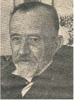
Resim 6; Abdülhak Hamid Tarhan