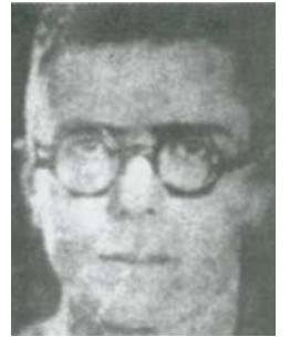
Resim 14; Arif Nihat Asya