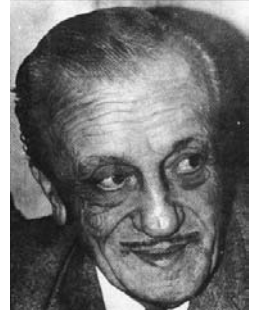
Resim 13; Necip Fazıl Kısakürek

Bilmem, neden gündelik işlerle telâştasın... Kızım, sen de Fâtih'ler doğuracak yaştasın!