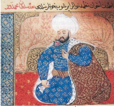
Resim 3: Meşahirü'sşüera'dan şair Fatih (Popüler Tarih sayı 33 s,78)