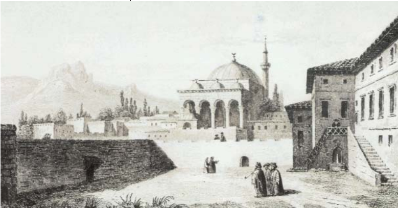
Resim 5; Erzurum - 1842

Bütün bu özellikleriyle İstanbul bir cazi- be merkezidir ve diğer şehirler ona gıpta ederler: derûn-ı bîrûnu magbût-ı bilâd-ı cihân