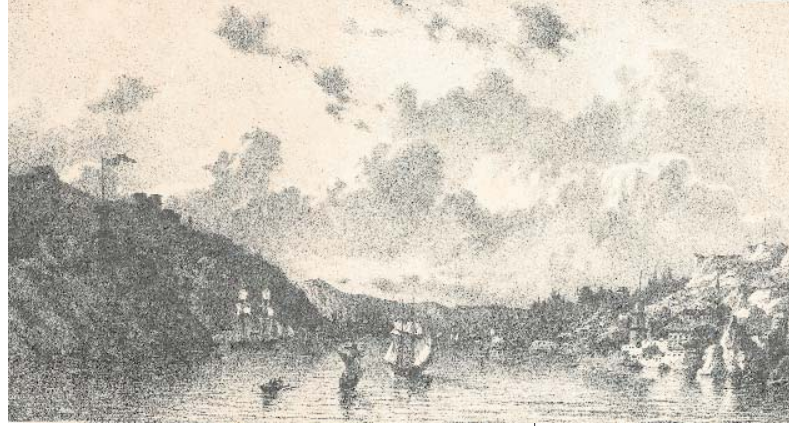
Resim 1; İstanbul Boğaz girişi, L'orient

Söz konusu eserlerde doğum ve yerleşme yeri olarak kaydedilen geniş bölge, şehir ve kasabaların adları, umumiyetle kısa ve genel bir ifade içerisinde zikredilmektedir. Bu genel görünüm dışında, tezkireler o mekânların, şairin kapasitesini besleyen sosyal, kültürel zenginlikleri ve canlılığı, özellikle coğrafi güzellik ve imkânları hakkında da bilgi vermektedirler. Bu tür tavsifler doğrudan doğruya bir mekân tespitinin ötesinde, anlatıma ince bir mana kazandırmaktadır ve çoğunlukla söz konusu bölge, şehir veya kasaba hakkında bilinenlerin tekrarı niteliğindedir. Ancak topluca bakıldığında, bu tavsifler bizi, edebiyatımızda eksikliğini hissettiğimiz bir edebî tür olan şehir monografilerine götürebilir (1) . Bu tür tavsifler hem bugünkü top-