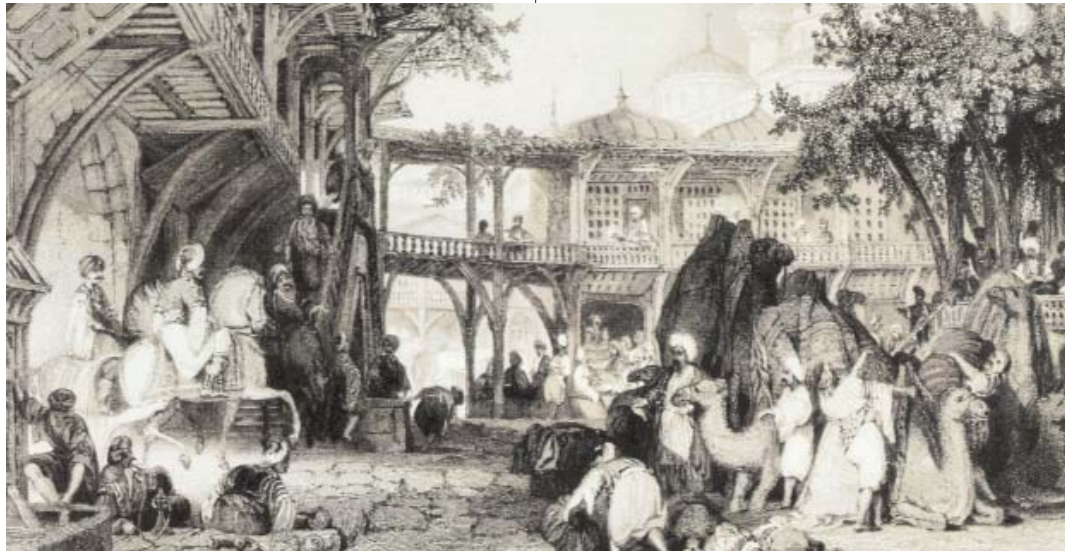
Resim 2; Aydın'da bir kervansaray-1839

İstanbul bugün olduğu gibi dün de kültür dünyamızın merkezidir. Şehir, en çok şair çıkarar yerdir. Doğum yeri baz alınırsa yetiştirdiği altı yüzden fazla şairle, Osmanlı kültür coğrafyasının en önemli şehridir (6) . Doğum yeri dışında yerleşme, eğitim açısından ele aldığımızda bu rakam hızla artacaktır. Osmanlı Türk kültür ve medeniyetinin merkezini oluşturması bakımından böyle ol-