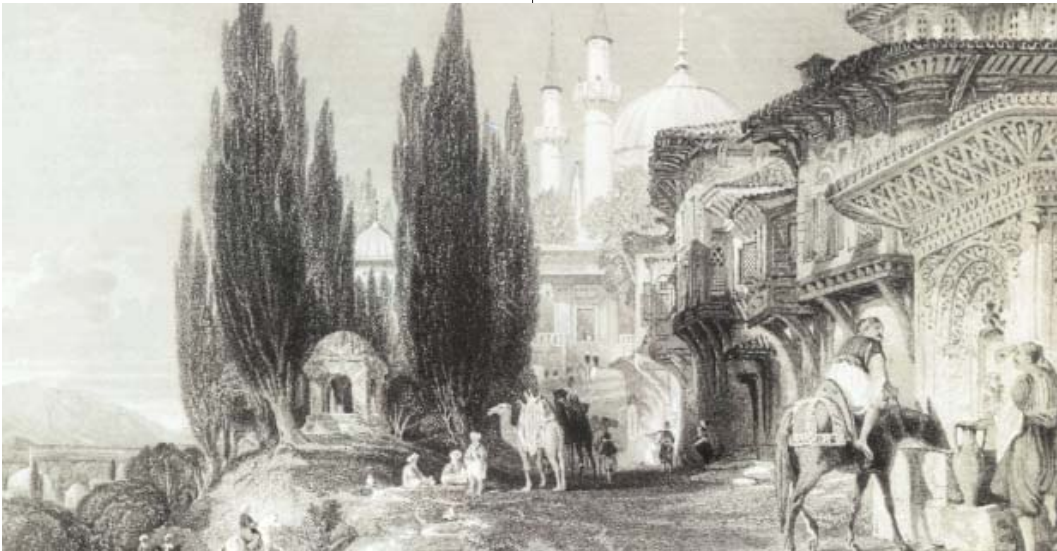
Resim 4; Bursa-Emir Sultan - 1839