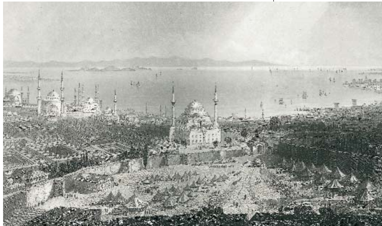
Resim 6; İstanbul, Gravür, Bosphorus, Miss Pardoe, Londra s.108)

718) halife Süleyman'ın vefatının ardından Emevî hilafetine geçen Ömer b. Abdülaziz'in (99-101/717-720) (77) muhasaranın kaldırılması için gönderdiği emir kuşatmayı sona erdirdi (78) . Bu şekilde tam bir yıl süren Emevîler devri üçüncü İstanbul kuşatması Bizans surları önünde parçalanmış oldu (79) . Sefer dönüsünde Müslümanlar hem