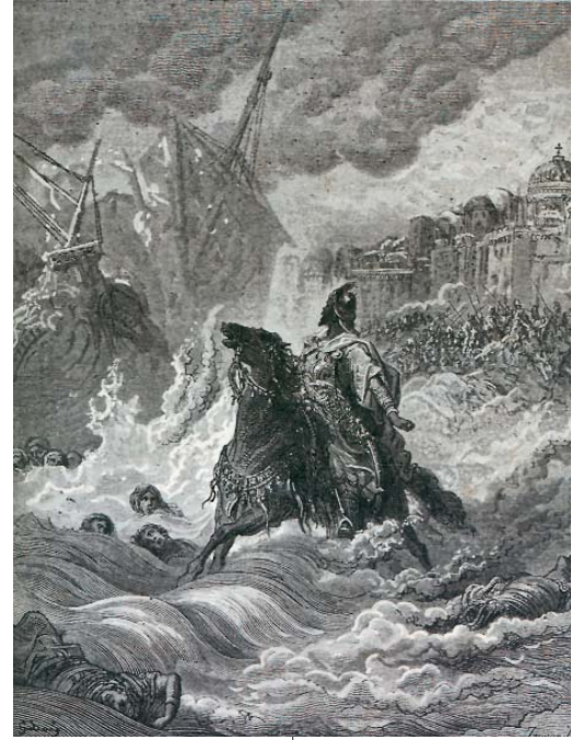
Resim 1; Fatih Sultan Mehmet İstanbul önlerinde donanmasını izliyor, Gravür (Haliç dergisi, sayı 3 s.25)

başladılar. Hz. Ömer ve halefi Hz. Osman zamanında 24-35(644-656) doğuda Maveraünnehir sınırına dayanan, batıda da Kuzey Afrika'yı içine alan fetihlere nazaran Anadolu'ya düzenlenen seferlerin çok düşük seviyede kaldığı görülür. Gerçekte Araplar Anadolu üzerine yaptıkları seferlerde adım adım kendi bölgelerini genişleterek Bizans topraklarını küçültmeye çalışmamışlardır. Ayrıca onlar ele geçirdikleri şehirleri korumak için gayret göstermemişler, sadece mutat olarak her yaz mevsiminde Amanos ya da Toros silsileleri yoluyla Anadolu içlerine seferler, bazen kış mevsiminde de devam eden akınlar gerçekleştirmişlerdir (3) . Bu seferler büyük orduların iştirak ettiği askerî faaliyetlerden ziyade, her yaz tekrarlanan ve büyüklü küçüklü askerî birliklerin katıldıkları taciz saldırısı ve ganimet elde etme girişimi niteliğindedir. Bu faaliyetleri, Bizans'ı yıldırma ve Anadolu Hz. Peygamber'in (sav) vefatından sonra halife seçilen Hz. Ebû Bekir yaklaşık iki yıl süren 11-13 (632-634) kısa hilafet dönemini Arabistan Yarımadası'nda siyasî birliği sağlatopraklarında bir ara bölge oluşturularak onların Suriye'ye saldırılarını engellemeye matuf girişimler olarak değerlendirmek mümkündür (4) . Taraflardan herhangi birinin üstün duruma geçmesinde, rakibin iç bünyesindeki çekişmelerin önemli rolü olmuş, bazen Bizanslılar, bazen de Araplar Anadolu hakimiyeti mücadelesinde