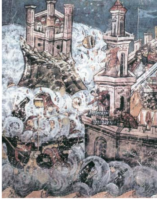
Resim 2; 15.yy'dan bir Roma freski: İstanbul kuşatma altında (Popüler Tarih sayı33 s,28)

birbirlerine üstünlük sağlamışlardır. Bununla birlikte ilişkilerde Müslümanlar genelde hücum eden taraf olurken, Bizanslılar savunma pozisyonunda kalmışlardır.