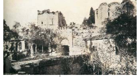
Resim 5; İstanbul surları, Zeytinburnu (Zeytinburnu Kitabı, s.131)

Velid b. Abdülmelik'in yerine halife olan kardeşi Süleyman b. Abdülmelik, selefinin