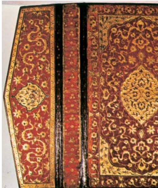
Resim 3; Kitap kabi, (Geleneysel Türk Sanatları, Mehmet Özel, Kültür Bakanlığı yayınıları 1993 s, 172

XVIII. yüzyılda "Osmanlı İmparatorluğu'nun Avrupa kültürüne hızla açılması toplumsal ve kültürel ortam kadar sanatı da etkilemiştir. Başta Osmanlı saray çevresinde Avrupa saray yaşantısına duyulan ilgi, öte yandan Avrupa'nın Osmanlı İmparatorluğu