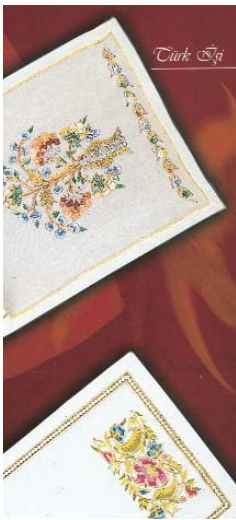
Resim 5; Elişi Örneği, İSMEK Kitabı, İBB Yay. İstanbul 1999

Türkiye Cumhuriyeti'nin kurucusu Başöğretmen Atatürk "1933 yılında Ankara Sergievi'ndeki Şark Süsleme Pavyonu'nu ziyaret eder. Muhsin Demironat'ı tebrik eder, ona süsleme motifleri hakkında sorular sorar. Yanında bulunan Milli Eğitim Bakanı'na "Bu sanatkârlara iyi bakıyor musunuz?" der ve uyarısına şöyle devam eder. "Bu sanatlar bizim öz sanatlarımızdır. Bu sahada mütehas-