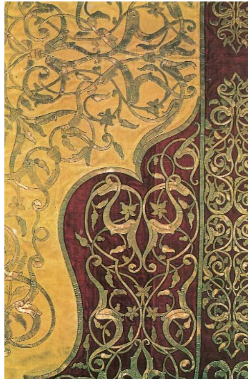
Resim 6; Seccade, detay (Geleneksel Türk Sanatları, Mehmet Özel, Kültür Bakanlığı yayınları 1993 s. 176)