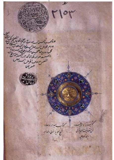
Resim 2; Süleymaniye Kütüphanesi, Ayasofya 3510 numaralı el-yazma. (Abdüsselam b. Ali b. Hasan el Ebrakuhi'nin Nihayetü'l mes'ul fi Dirayeti'r Rasu'l adlı tarih kitabı.905 H/1599M tarihinde istinsah edilmiştir. II.Bayezid dönemine aittir.)