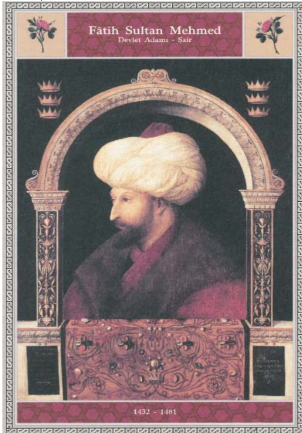
Resim 1; Medeniyetimize damgasını vuranlar (Albüm,Albıraka Türk 2002)