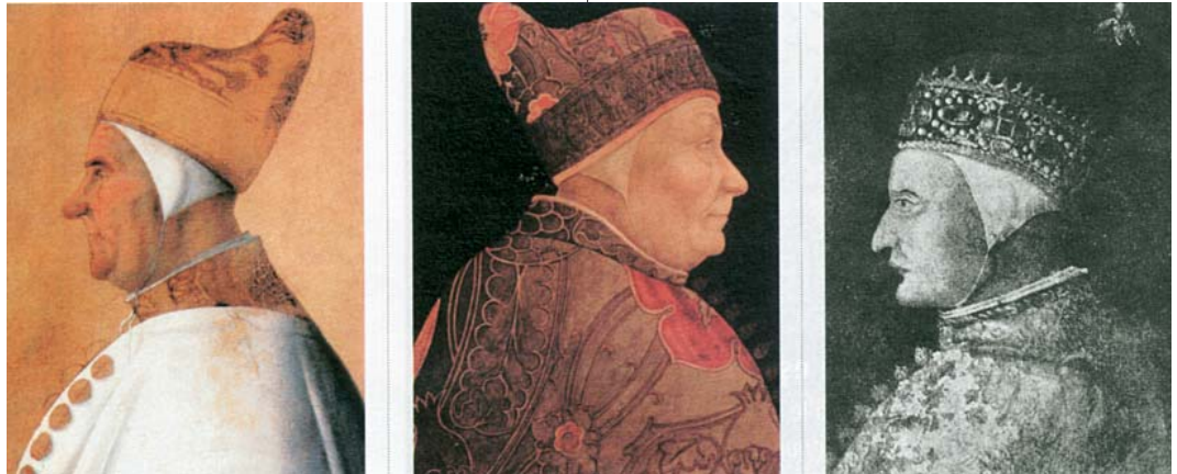
Resim 3; Üç Venedik Doge'ü, Centile Bellini, (Popüler Tarih, Sayı 33, s.41)