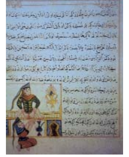
Resim 7; Cerrahiyyetül Haniyye, Paris Nüshası.

Cerrahiyyetü'l Haniyye, Türk İslam dünyasında cerrahi teknikleri açıklamak amacıyla resmin kullanıldığı ilk ve nadir bir eserdir. Resimleri estetik açıdan önemli bir değere sahip olmasalar da, sade anlatımlarıyla metni destekleyici ve cerrahi müdahaleleri açıklayıcı özelliklere sahiptirler. Her iki nüshanın minyatürlerinde figürlerin konumlandığı bir mekan yoktur. Sadece geride zaman zaman ağaç veya bitki motifleri görülmektedir. Hekim tipi genellikle sarıklı ve sakallıdır. Oturur pozisyonda resmedilmiştir. Kendine güvenli ve deneyimli bir izlenim vermektedir. Hasta figürleri kadın, erkek, genç, yaşlı, çocuk olmak üzere gösterilmiştir. Figürlerde muayenenin gerektirdiği birkaç duruş tipi uygulanmıştır. Hastaların tedavisi sırasında yardımcı olarak kullanılan elemanlar görülmektedir. Kadın-doğum müdahaleleri resmedilirken herhangi bir taassup gösterilmemiş olması ilgi çekicidir.