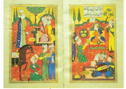
Resim 1; Dilsuzname

Minyatürlerden birinde Sultan çevresi ile