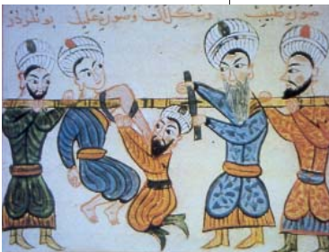
Resim 6; Cerrahyetül Haniyye, Paris Nüshası.