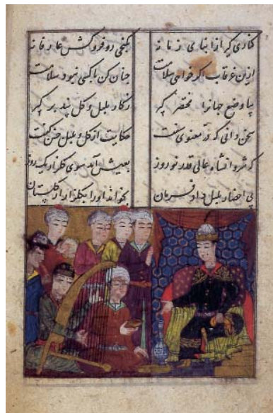
Resim 3; Eyüp ve Salman Sultanın meclisinde, Külliyyat-ı Katibi