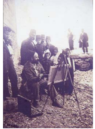
Resim 8: Fotoğrafçı Ali Sami (Aközer)'nin objektifinden Zonaro tuvali, şövalesi ve fırçasıyla İstanbul sokaklarında. (Aile koleksiyonu) (Öndeş-Makzume, Osmanlı Saray Ressamı Fausto Zonaro, s.105)

Son olarak eklemek gerekirse, buradaki asıl amacımız Hasan Rıza'nın bu kompozis-