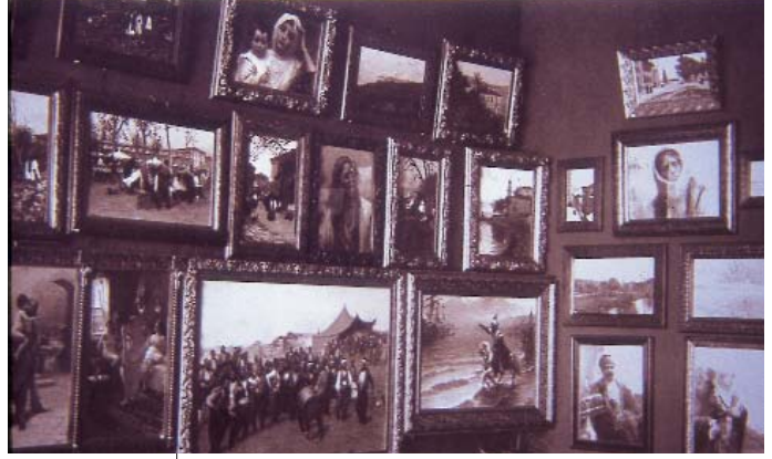
Resim 7: Elisa'nın objektifinden Fausto Zonaro'nun Akaretler'deki galerisindeki tablolar. Ortada Fatih Sultan Mehmed'in Haliç'te atını denize sürmesi tablosu çerçevesiz olarak görülmekte. (Aile koleksiyonu), (Öndeş-Makzume, Osmanlı Saray Ressamı Fausto Zonaro , s.105)

laştığını (7) ve 1891'de İstanbul'a geldiğini görüyoruz (8) (Resim: 6,7,8,9)