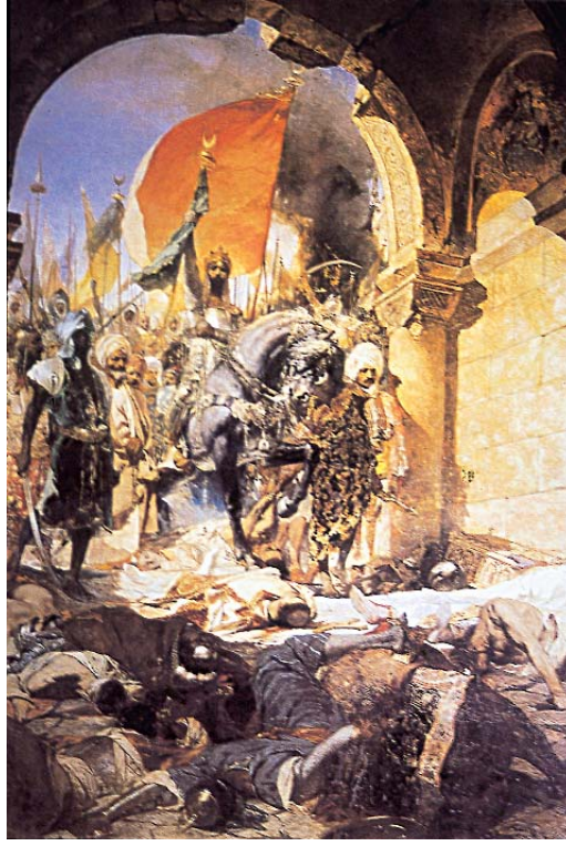
Resim 10: Jean-Joseph Benjamin-Constant (1845-1902), "Fatih Sultan Mehmed'in 29 Mayıs 1453'te İstanbul'a Girişi", (1876, imzalı), Tuval üzerine yağlıboya, ?x? cm., (Musée des Augustins, Toulouse/Fransa), (ANONİM, Fatih ve Fethih , Tarih ve Tabiat Vakfı TATAV Yayınları, İstanbul 2003. R.82)