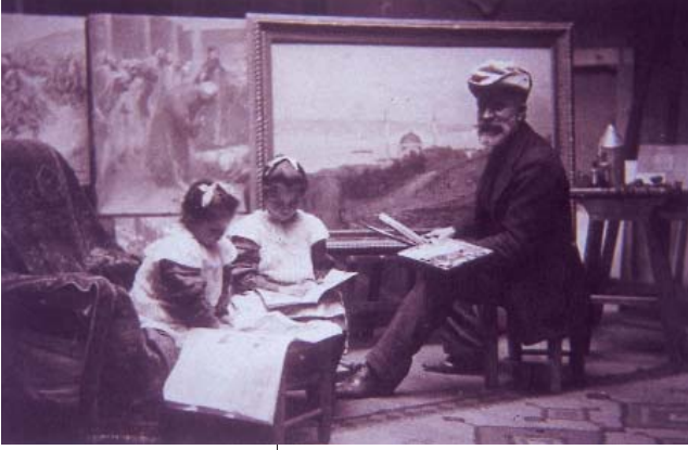
Resim 6: Elisa'nın objektifinden Fausto Zonaro çocukları Faustino, Faustone, Mafalda ve Jolanda ile atölyesinde çalışırken. Sol tarafta "Fatih Sultan Mehmed'in Atını Denize Sürmesi" adlı tablosu çerçevesiz olarak görülmekte. (Aile koleksiyonu) (Osman Öndeş-Erol Makzume, Osmanlı Saray Ressamı Fausto Zonaro , YKY, İstanbul 2003, s.100)