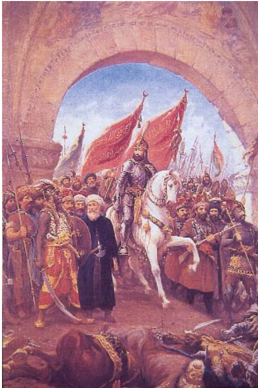
Resim 11: Hasan Rıza, "Fatih Sultan Mehmed'in Topkapı'dan İstanbul'a Girişi", (imzalı, tarihsiz), çini mürekkebiyle tarama, 72x52 cm., (İstanbul Deniz Müzesi koleksiyonu) (Özdeniz, Türk Deniz Subayı Ressamları, s. 45)