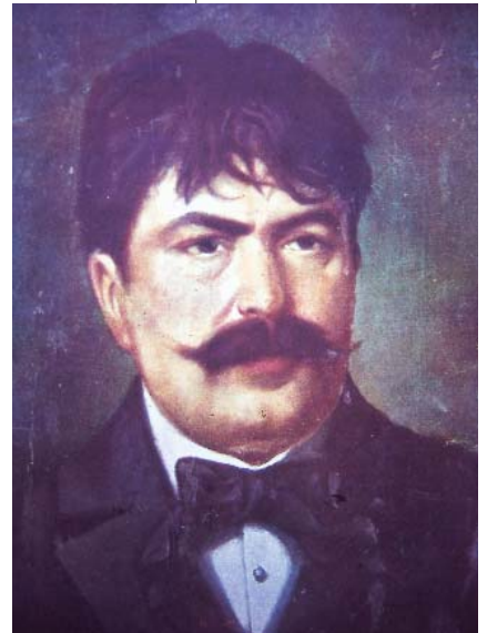
Resim 1: Hasan Rıza, "Otoportre", Yağlıboya, ?x? cm., (Özel koleksiyon?), (S. Ünver, Ressam Şehit Hasan Rıza'dan )