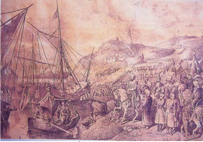
Resim 13: Hasan Rıza, "İstanbul'un Kuşatılmasında Fatih Sultan Mehmed'in Gemilerin Karadan Yürütülmesine Nezareti", (imzalı, H.1312 ya da 1313/1896 veya 1897), çini mürekkebiyle tarama, 52x65 cm., (İstanbul Deniz Müzesi koleksiyonu) (Özdeniz, Türk Deniz Subayı Ressamları, s. 46)